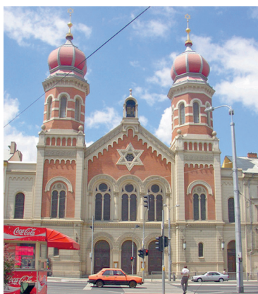
< http://upload.wikimedia.org/wikipedia/commons/3/3c/ >. Luettu 25.9.2010.