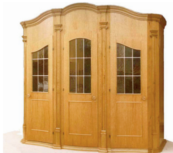
< http://www.kircheneinrichtungen.de/ >. Luettu 25.9.2010.