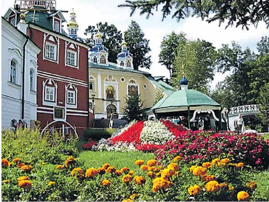
Petserin luostarialueen kauneutta.

destään. Asukkaat ovat pääosin ortodokseja. Alueella on ollut asutusta jo 7000 vuotta. Vanhan ja uuden, menneisyyden ja nykyisyyden välillä on suurempi kuin kenties missään muualla Virossa.