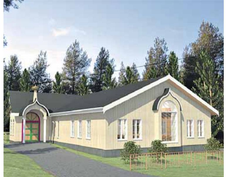
Petsamo-salin eksteriööri.