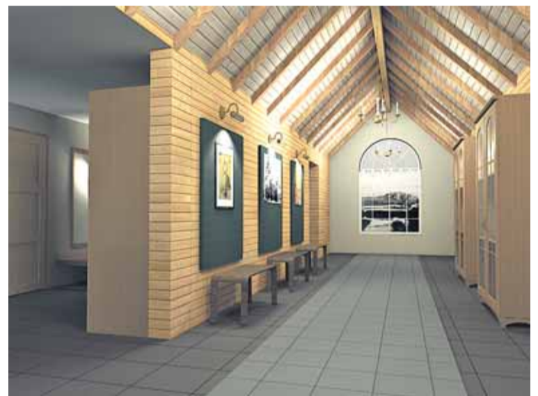
Näkymä Petsamo-salin näyttelytilaan.

Rovaniemen ortodoksinen seurakuntasalin eli Petsamo-salin rakentaminen on edennyt hyvin ja uusi sali valmistuu kevään aikana. Seurakunnan vapaaehtoiset ovat perustaneet runsas vuosi sitten yhdistyksen Petsamo-salin tuki ry:n, jonka tämänhetkisenä päämääränä on kampanjoida kalusteita seurakuntasaliin.