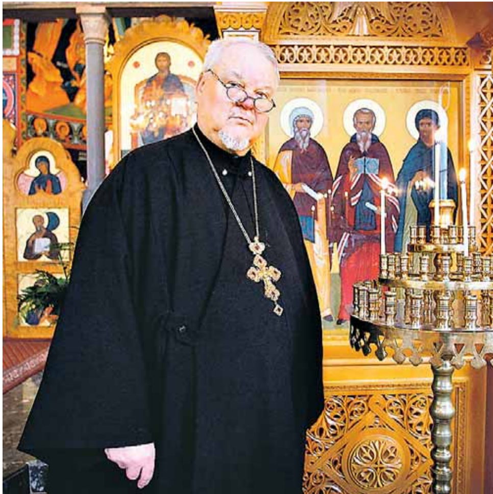
Tulevan eläkeläisen joulumiete: "Betlehemin köyhien paimentolaisten hakkaama luola ja Luukkaan evankeliumin herkkyydessään ja koruttomuudessaan ainutlaatuisen yksinkertainen syntymän kuvaus olivat jotakin täysin uutta maailmalle, joka odotti lunastajaa palatsien loistosta tai yläluokkaisen hienostuneisuuden valmistamasta elämänpöydästä."

telijat opettivat omalla esimerkillään, että olipa lähimmäistemme persoonallisuus, ja heikkoudet inhimillisesti ajatellen kuinka vaikeita tahansa, niin kristityn tulee rakastaa ja kunnioittaa siitäkin huolimatta häntä täysin pyyteettömästi. Jokaisessa ihmisessä on luomisen perusteella Jumalan kuva. Juuri tämän vuoksi kristitylle lähimmäinen on aina myös Jumalan hänelle antama lahja. Isien opetuksessa hankalakin lähimmäiset nähdään, ei suinkaan taakkoina, vaan mahdollisuuksina.