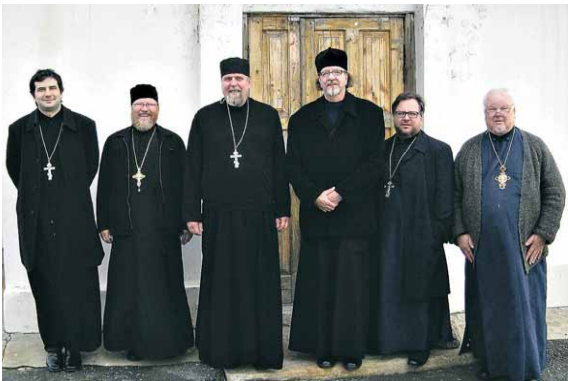
Hiippakunnan piispan ja kirkkoherrojen vuosittainen työ- ja opintomatka suuntautui syyskuun 2010 alussa Kuolan alueelle Venäjälle, Murmanskin hiippakunnan vieraaksi. Kuvassa matkalaiset ovat Nikkelin kirkon edessä.