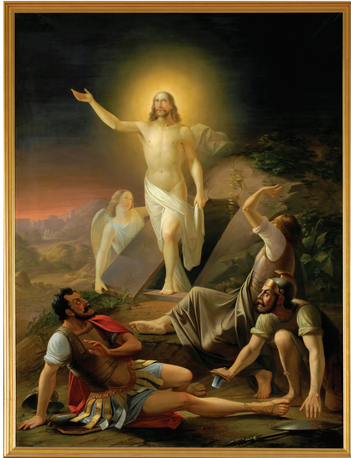
B. A. Godenhjelm: Ylösnousemus , 1845. < http://www.vihdinseurakunta.fi >. Luettu 8.1.2016.