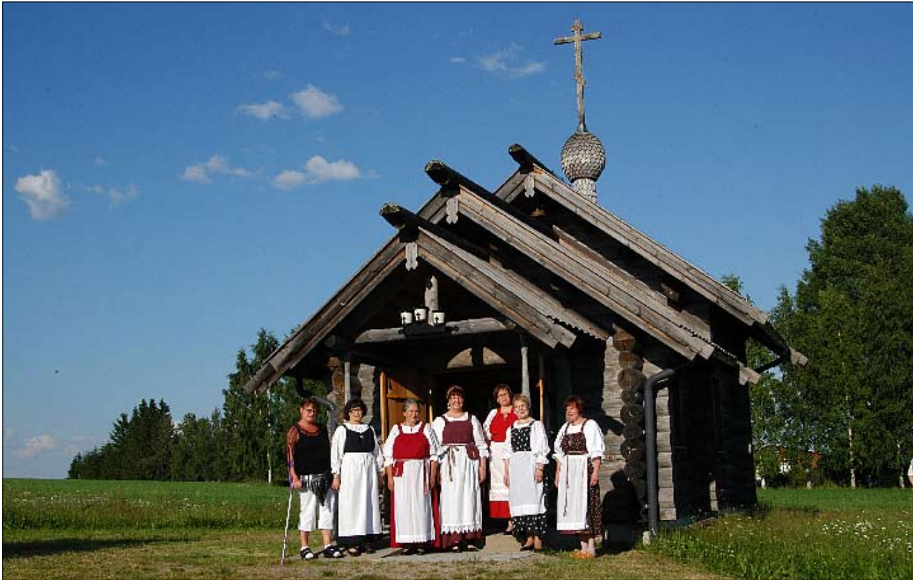
Angelos-kuoron Pohjois-Karjalan kiertueeseen kuului muun muassa konsertti Sonkajan Ristin ylentämisen tsanounalla Iloimantsissa.

Jumalansyntyttäjän Neitseen Marian syntymän juhlaa vietetään torstaina 8. syyskuuta.