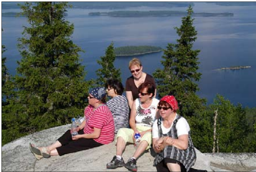
Angeloksien Pohjois-Karjalan kiertueen huippukohta oli kipuaminen Kolille. Ja huipulla kuorolaisia laulatti.

dyimme yhteislaulun seurassa. Ja niihin lauluihin yhtyivät myös ympäristön linnut, kääkikin kukkui kuin Karjalassa kuuluukin.