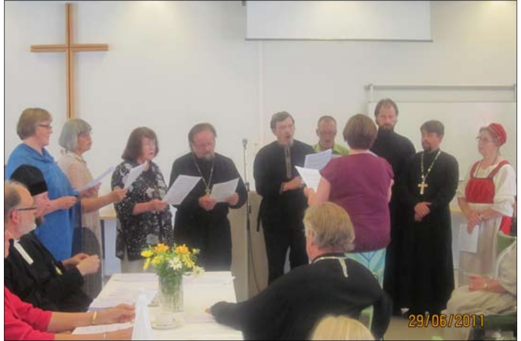
Tuusniemen temppelin vihkimisen 50-vuotisjuhla yhdistyi Pietarin ja Paavalin kirkon praasniekkaan.