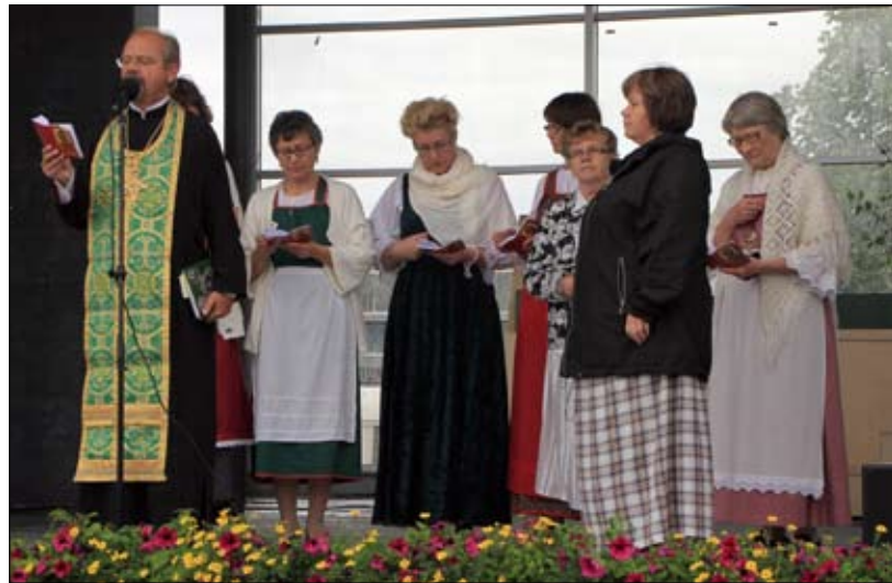
Evakon pruasniekka aloitettiin Iisalmen torilla, jossa toimitettiin kaikelle kansalle aamuhartaus.