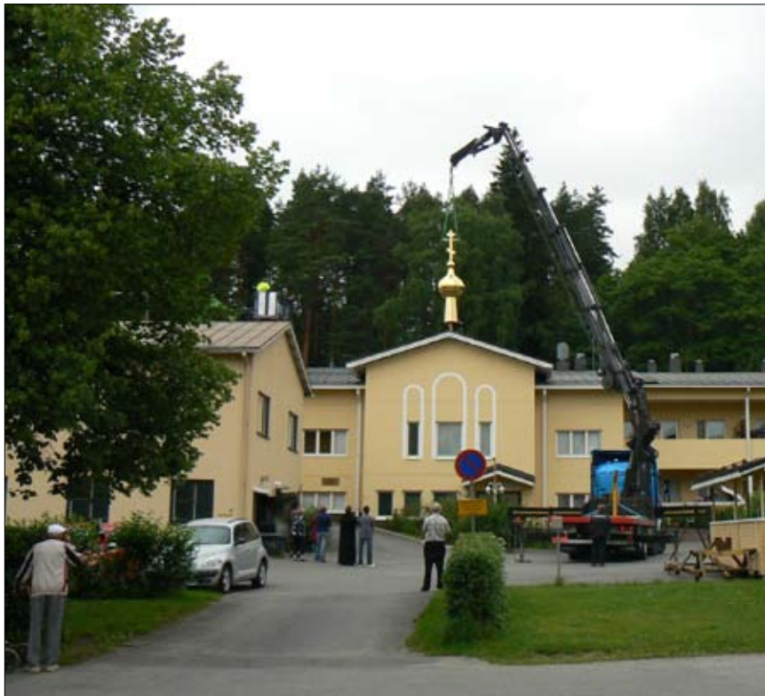
Kupoli matkasi varta vasten sille rakennetulla telineellä Kallvikista Jyväskylään.

Loppu hyvin – kaikki hyvin! Siellä se nyt todistaa paikallaan päitsi omasta uskostamme, myös rakkaudesta ja huolenpidosta.