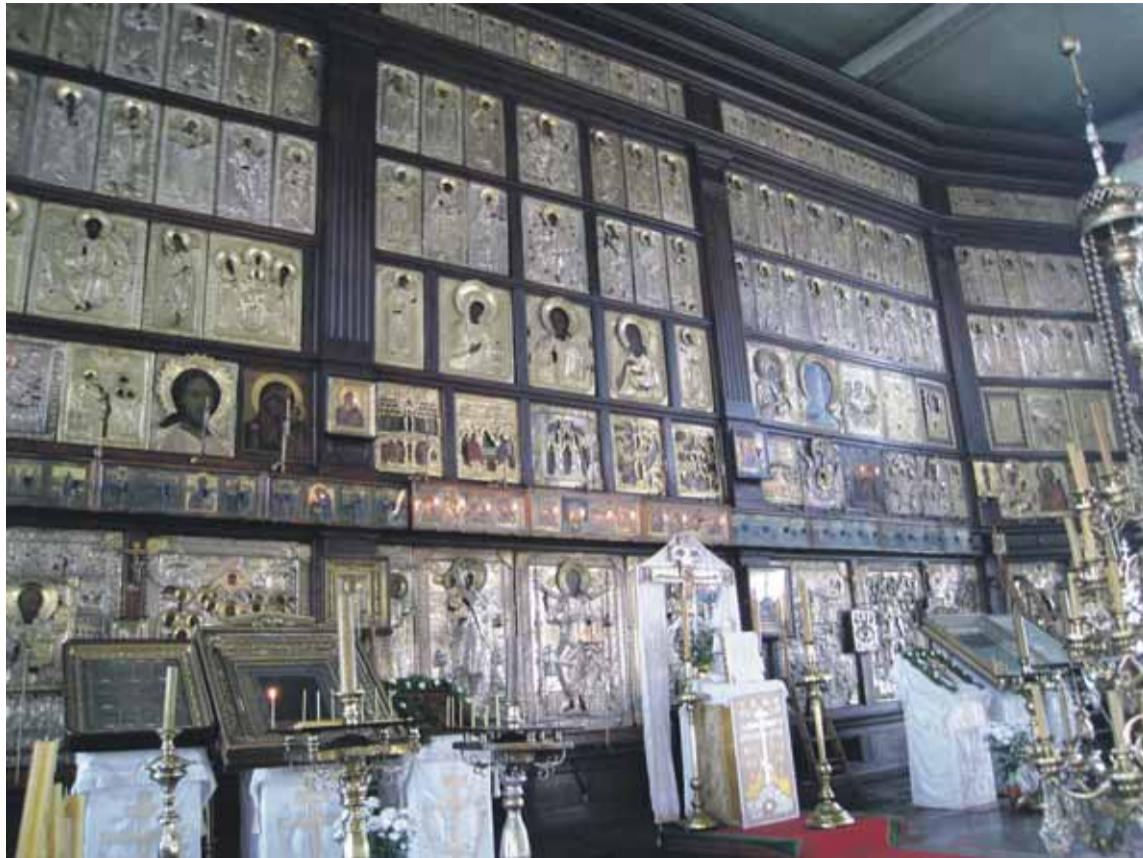
Vanhauskoiset papittomat: Riikassa sijaitsee papittomien vanhauskoisten pyhäkkö. Rukoushuone on täynnä ainutlaatuisia ikoniaarteita.

toiminut, Latvian arkkipiispa Johannes Pommer . Hän oli syntyperältään latvialainen ja juuri siksi kansansa rakastama esipaimen. Vaikka hän oli Venäjän kirkon piispa, hän kritisoi ankarasti kommunistista ideologiaa. Esipaimen Johannes tahtoi myös antaa tilaa kansallisen ortodoksian voimistumiselle. Tämänlaisen toiminnan seurauksena kommunistit surmasivat hänet vuonna 1934. Punainen hallinto otti 1960-luvulla Riian pääkirkon haltuunsa ja perusti siihen planetaarion. Neuvostoliiton hajottua pyhäkkö palautettiin takaisin arvoonsa ja Venäjän kirkko kanonisoi arkkipiispa Johanneksen pyhäksi vuonna 2001. Hänen pyrkimyksiään koetetaan jatkaa muun muassa siten, että Latvian ortodoksisen kirkon sisään on perustettu myös latviankielisiä seurakuntia, venäjänkielisten rinnalle.