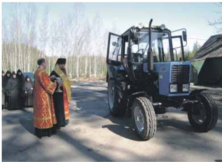
Kirkko arjessa: piispa siunaa Kolminaisuuden naisluostarin skiitille lahjoitetun traktorin.