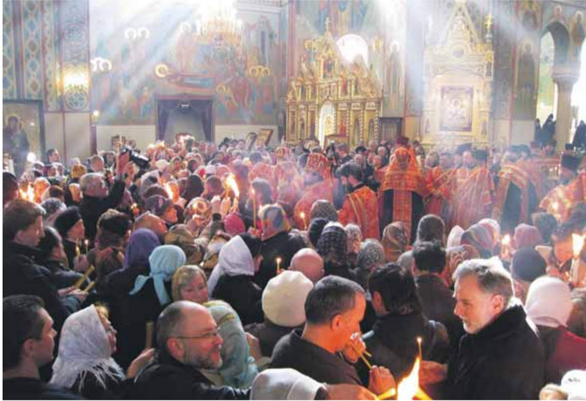
Pyhä Tuli: Papisto jakaa Jerusalemissa tuotua pyhän haudan tulta kirkkokansalle.