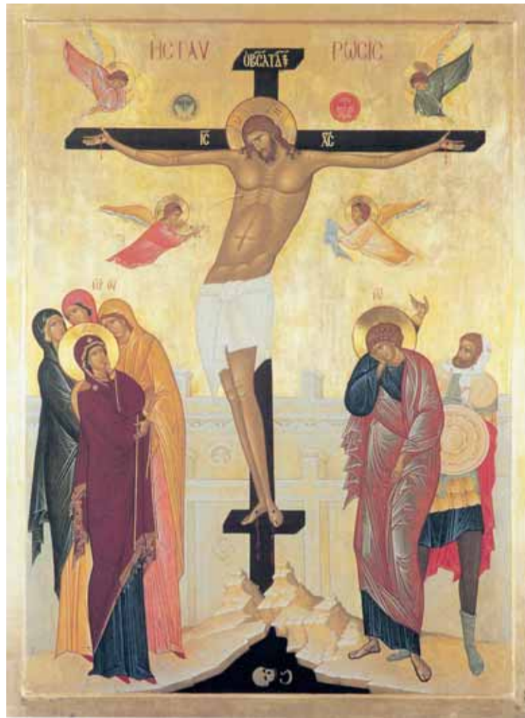
Ristiinnaulittu kunnian kuningas. Venäläinen ikoni 1997.

tarkoitettu tuomaan todellista iloa jokaisen Kristukseen uskovan mieleen. Kaikkien niiden, jotka paastoten ja rukoillen ja muuten ovat valmistautuneet juhlan viettoon, tulisi kokea uskonsa riemullinen täyttymys.