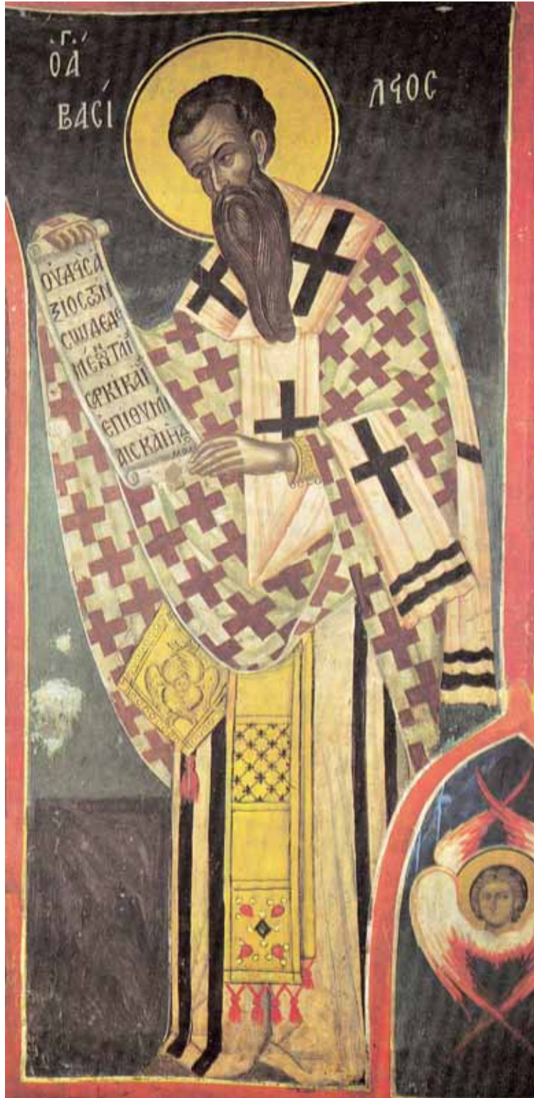
Kirkkoisä Basileios Suuren (k. 379) mukaan ihminen voi kehittyä hyveissä jopa enkelien tasolle. Theofanes Kreetalaisen ikoni 1500-luvulta.

Jumalan tunteminen suodaan heille, joilla on puhdas sydän ja mieli. Heidän ruumiinsa ja sielunsa on kirkastunut Jumalan luomatomasta valkeudesta. Ortodoksinen teologia edellyttää aina osallistumista uskon salaisuudesta. Jumalan tunteminen on elämää, toimintaa ja kokemusta. Jumalan kokemisessa ja osallistumisessa hänen elämänsä, teologia ylittää intellektuaaliset ja rationaal-