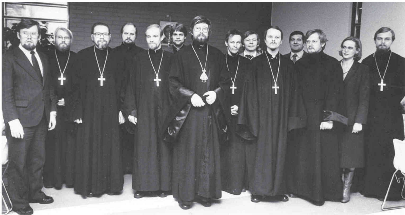
Oulun ortodoksisen hiippakunnan perustamisesta tuli kuluneeksi 30 vuotta 1.1.2010. Kuva ensimmäisiltä hiippakuntapäiviltä joulukuussa 1980.