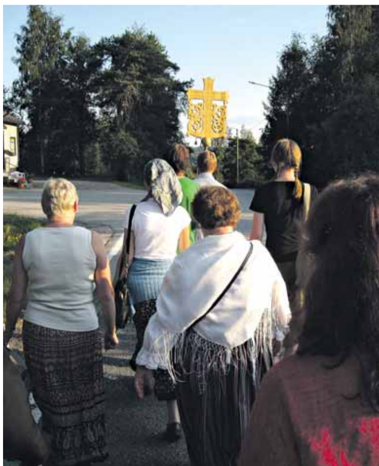
Valokuva: Ortodoksiset kirkkopäivät

etenevä suurristsaatto. Kirkkopäivillä esiintyvät mm. Uspenskin katedraalikuoro ja Kanttorikuoro. Lisäksi ta-