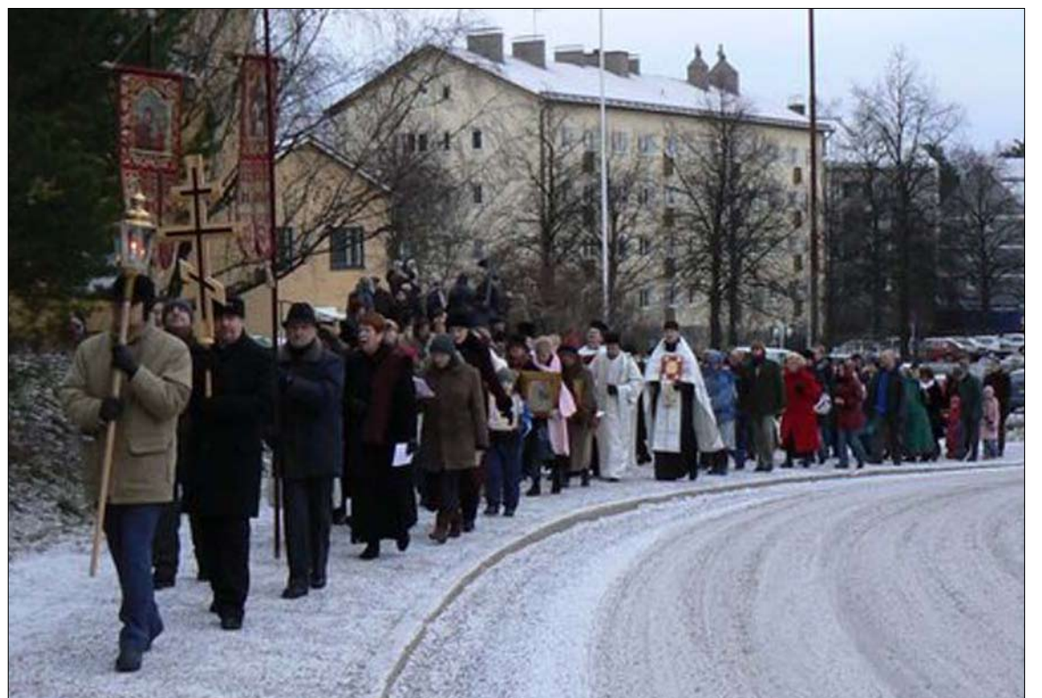
Teofanian ristisaattoon osallistui yli sata henkeä.

Juhlaliturgian jälkeen yli 100 seurakuntalaista osallistui ristisaattoon Tuomiojärven rantaan, jossa toimitettiin vedenpyhitys.