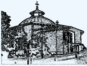
MIKKELIN ORTODOKSINEN SEURAKUNTA

Paavalinkatu 4 50130 MIKKELI puh/fax. (015) 213 352 s-posti: mikkeli@ort.fi