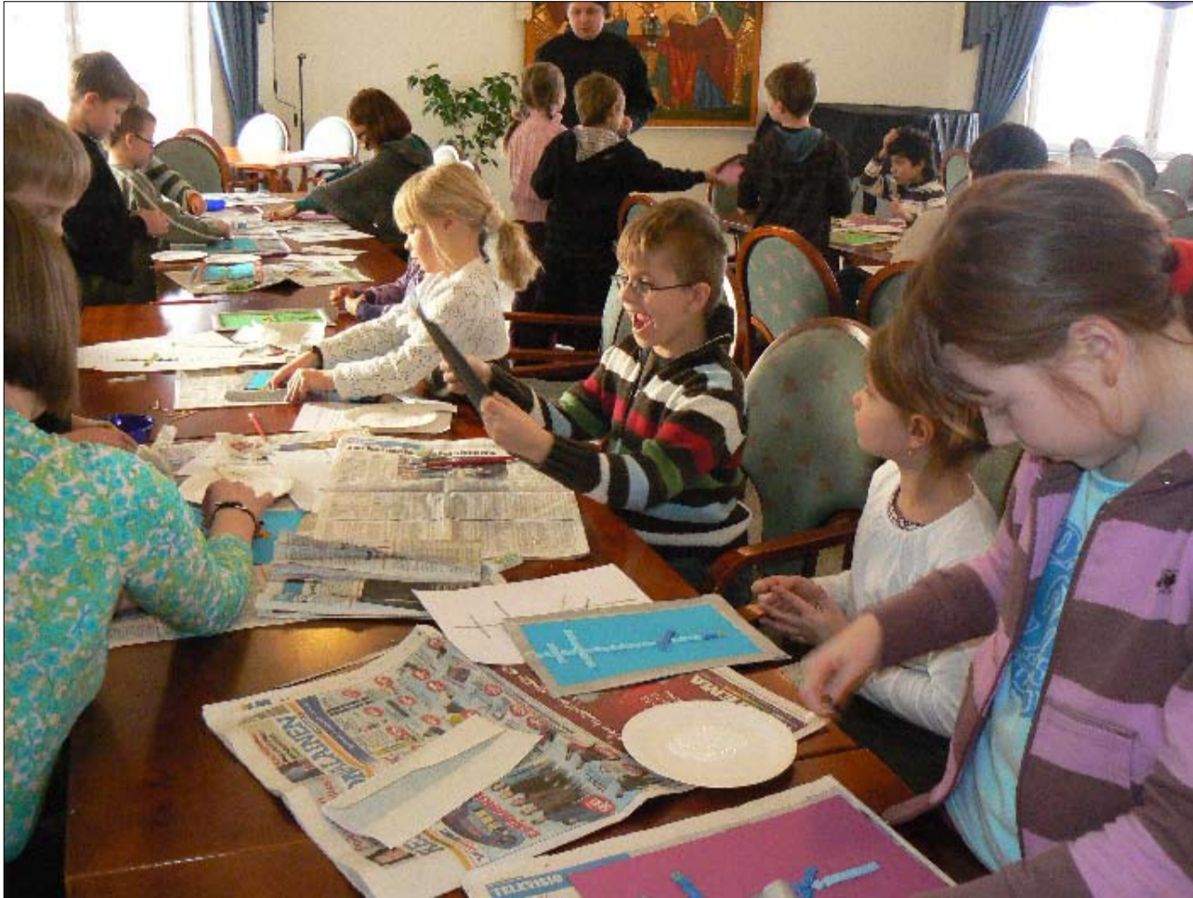
Ykkös-, kakkos- ja kolmasluokkalaisten teemapäivää vietettiin Jyväskylän ortodoksisessa seurakunnassa 2. helmikuuta.

Perinteinen käsinmaalattujen ja eri menetelmin koristeltujen pääsiäismunien myyntinäyttely Jyväskylässä 27.3. – 3.4.2011 ortodoksisen seurakunnan juhlasalissa Näyttely on esillä lauantaina klo 12-14 ja muina päivinä klo 10 – 14 Tervetuloa!