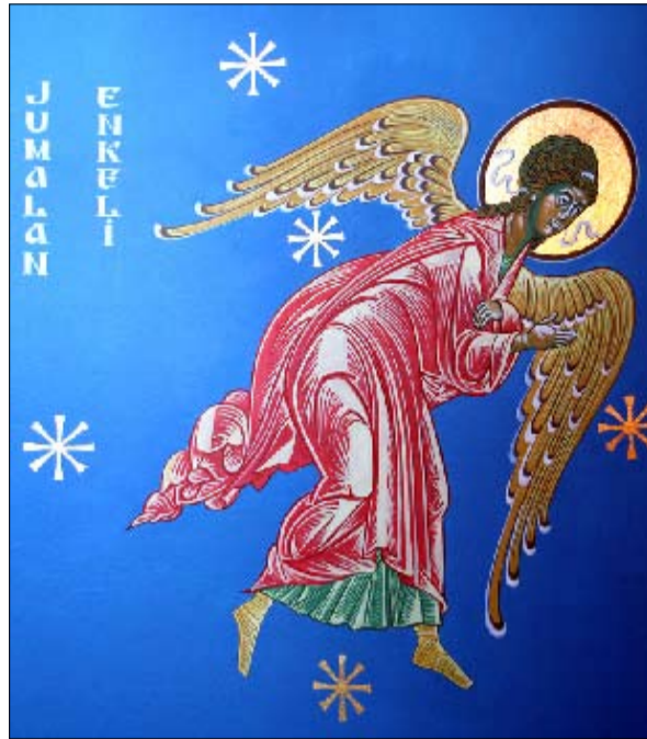
Viisaus loistaa aurinkoa kirkaammin!

Vanhan ja Uuden Testamentin väliseen ajanjaksoon liittyvät oleellisesti Apokryfykirjat Sana apokryyfinen tarkoittaa kätkettyä. Meidän ortodoksinen perinne käyttää näistä kirjoista nimitystä deuterokanoninen eli toiseen kanoniin kuuluva. Edellä mainitut kirjat ovat syntyneet hellenistisenä aikana noin vuosina 200 ekr.-50 jkr. Suomen Piilaseura on hiltattain julkaissut raamatun, johon on protestanttisen perinteen mukaan apokryfykirjat sijoitettu yhtenä erillisenä koelmana Vanhan Testamentin ja Uuden Testamentin väliin.