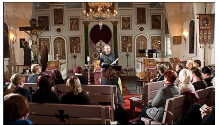
Yhteen ääneen -laulutapahtuman osallistajat 27.2.2010