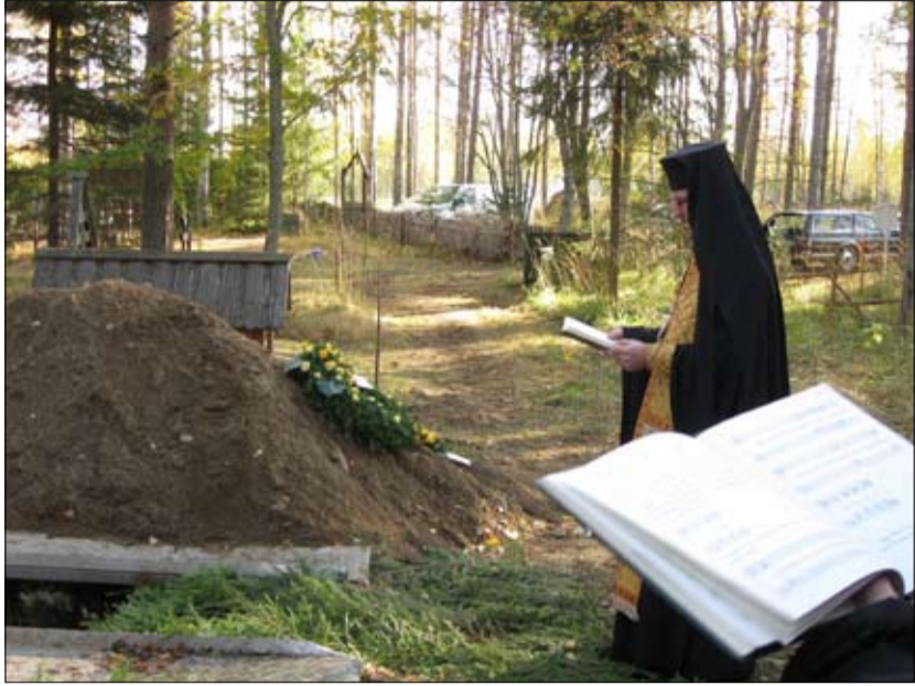
Ortodoksisessa hautajaispalvelussa yhdessä rukoillen saatamme poisnukkuneen Jumalanpalvelijan tuonilmaisiiin.