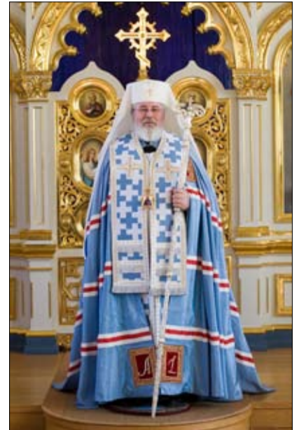
Suuren paaston viimeinen päivä on 3.4. Sunnuntaina 4.4. vietetään Heran Pääsiäistä.

Näin eri uskontojen historiaa ja arvoja ei voida opettaa vain vertaillen tai näennäisen neutraalista. Uskonnot eivät voi myöskään alistua valtiollisen tai minikään muunkaan ulkopuolisen ideologian ohjattaviksi.