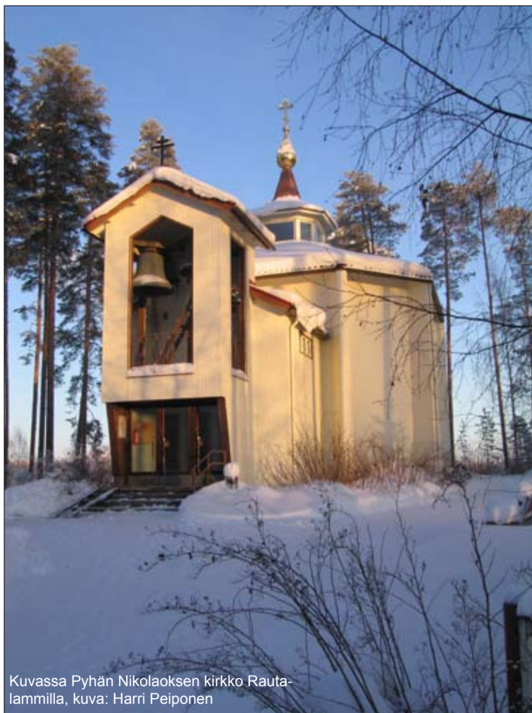
Kuvassa Pyhän Nikolaoksen kirkko Rautalammissa, kuva: Harri Peiponen

Seurakunta järjestää Agape-aterian pääsiäisyönä Rämäkällä (Rämäkkätie 50, Rautalampi) – tarkemmat tiedot seurakunnan nettisivuilla ja Sisä-Savo lehdestä.