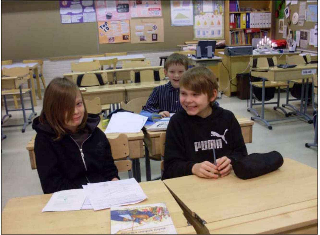
Poikakolmikko edustaa ehdottomasti oppimisen iloa.