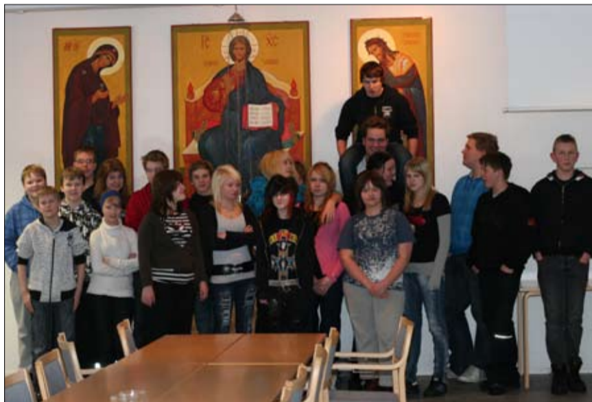
Ahmon ja Maaninkajärven yläkoululaiset kokoontuivat helmikuussa yhteen Siilinjärven seurakuntasalille. Iso joukko ortodoksia nuoria pääsi tutustumaan toisiinsa pelien ja leipomisen merkeissä. Vastaavaa iltapäivää toivottiin myös ensi vuodelle.