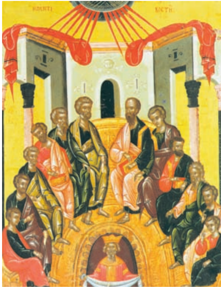
Pyhän Hengen vuodattaminen. Ikoni Athosvuoren Dionisioksen luostarista vuodelta 1547.

Kaikki ihmiset on kutsuttu Kristuksen yhteyteen. Yhteisymmärrystä vaikeuttava kielimuuri oli ensimmäinen