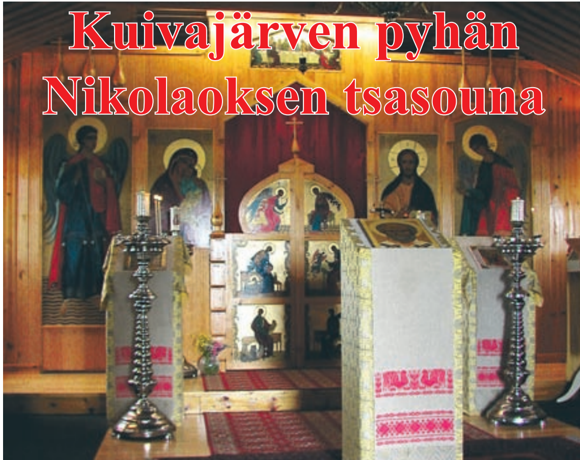
Pyhän Nikolaoksen tsasounan tunnelmallinen interiööri.