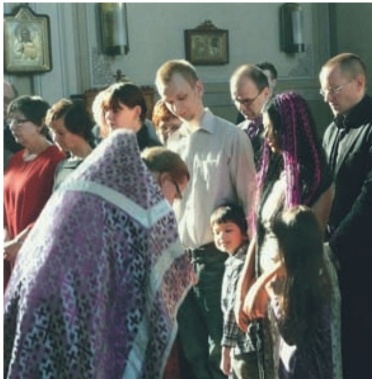
Suurena lauantaina 22.3.2008 Vaasan pyhän Nikolaoksen kirkossa liitettiin kymmenen ihmistä ortodoksisen kirkkoon.

Teemme kartoituksen liitteenä olevalla kyselyllä. Voit joko postittaa sen yllä olevaan seurakunnan osoitteeseen tai soittaa jollekin diakoniatoimi-