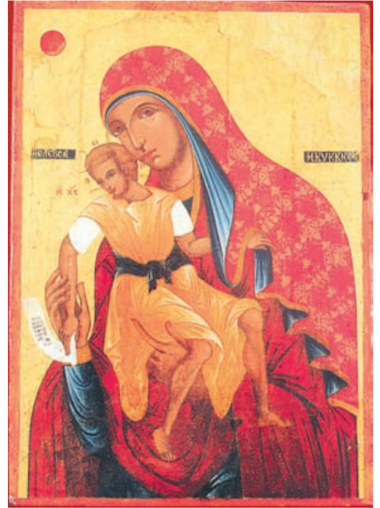
Jumalanäiti on rukoilijana vailla vertaa. Hellyys-ikoni, Kykkon luostari, Kypros, 1500-1600-luvut.

Kirkon pyhät isät kutsuvat rukousta toisinaan hengelliseksi hengitykseksi. Rukous on valkeutta pimeydessä ja toivoa epätoivossa. Kirkon yhteinen rukous etsii Kristuksen läsnäoloa ja tunnistaa hänet jokaisessa ihmisessä. Tämä merkitsee sitä, että rukous johtaa välittömästi lähimmäisestä huolehtimiseen. Ja vielä enemmänkin: kaikki lähimmäisiin kohdistuva palveluksen työ on itsessään rukousta.