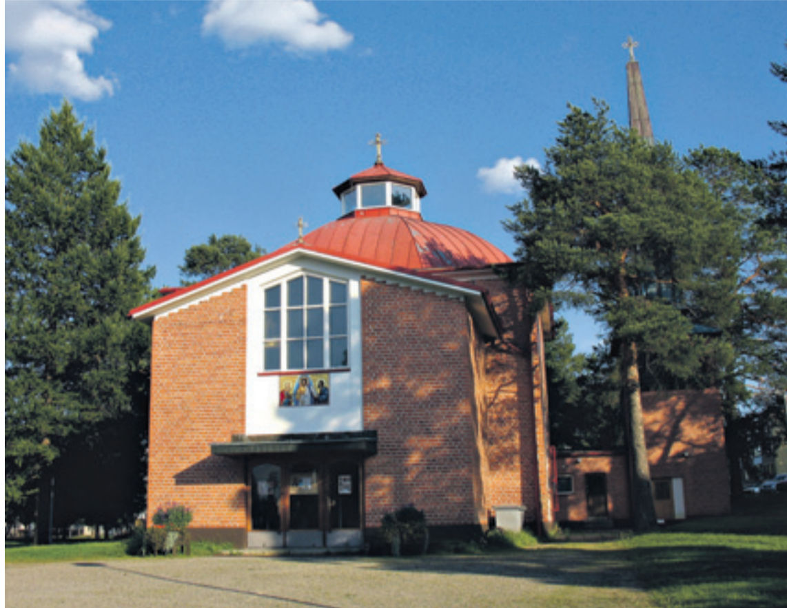
Kristuksen kirkastumisen kirkko, Kajaani.