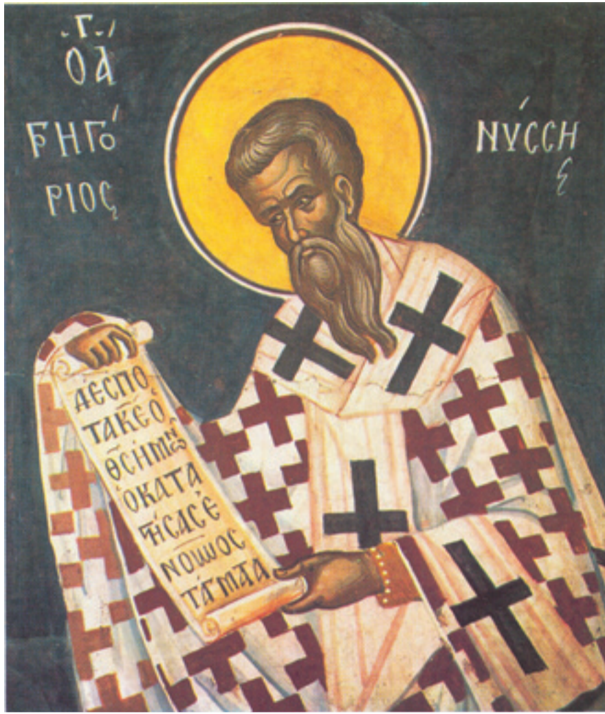
Kirkkoisä Gregorios Nyssalainen (335-394 JKr.) korosti opetuksissaan ihmisen kasvamista kohti Jumalan kaltaisuutta. Kreikkalainen ikoni 1500-luvulta.

Elävä usko tarvitsee ilmaisumuotoja elääkseen ja hengittääkseen. Pyhien isien mukaan teoreettista uskoa ei ole olemassakaan. Jumalaa ei voi oppia tuntemaan loogisesti, mutta Häntä voi oppia palvelemaan ja rakastamaan.