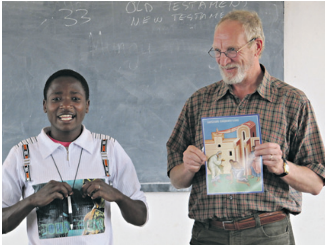
Veli-Matti Heikkilän tehtävänä oli opettaa tansanialaisille nuorille Jeesuksen elämästä ja opetuksista.

muslimeja sekä luonnonuskontojen kannattajia.