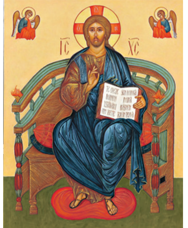
Kristus valtaistuimella.

Vanha testamentti sai nykyisen muotonsa pääosin 500-200 eKr. ja Uuden testamentin kaanon vahvistettiin Rooman valtakunnan itäisessä kirkossa 300-luvun puolivälissä. Raamattu on kirjoitettu Jumalan inspiroimana lukuisien eri ihmisten toimesta kirjoittajien ollessa luonnollisesti oman aikansa lapsia käyttäen aikansa kieltä ja käsitteitä. Raamatun ja muiden pyhien kirjoitusten kirjoittajien ihmiskäsitys ja tietämystaso tämän puoleisista asioista riippui kulloisenkin historiallisen ajanjakson tiedon tasosta ja kunkin kirjoittajan henkilökohtaisesta opillisesta sivistyksestä. Jokainen ihminen on aina oman aikansa vanki. Tietyiltä osin, ilmiänsultaan, Raamattukin ikuisine totuuksineen on nähtävä myös oman aikansa lapsena.