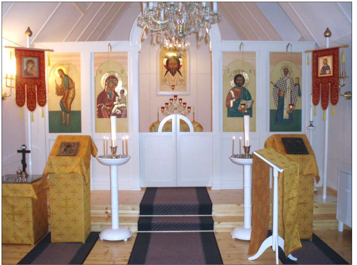
Salahmin Pyhän Nikolaoksen tsasounassa juhlittiin sunnuntaina 17. joulukuuta. Lue lisää seuraavasta Soleasta.