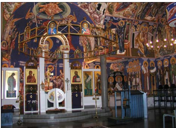
Herman Alaskalaisen kirkon seinät ovat täynnä maalauksia.