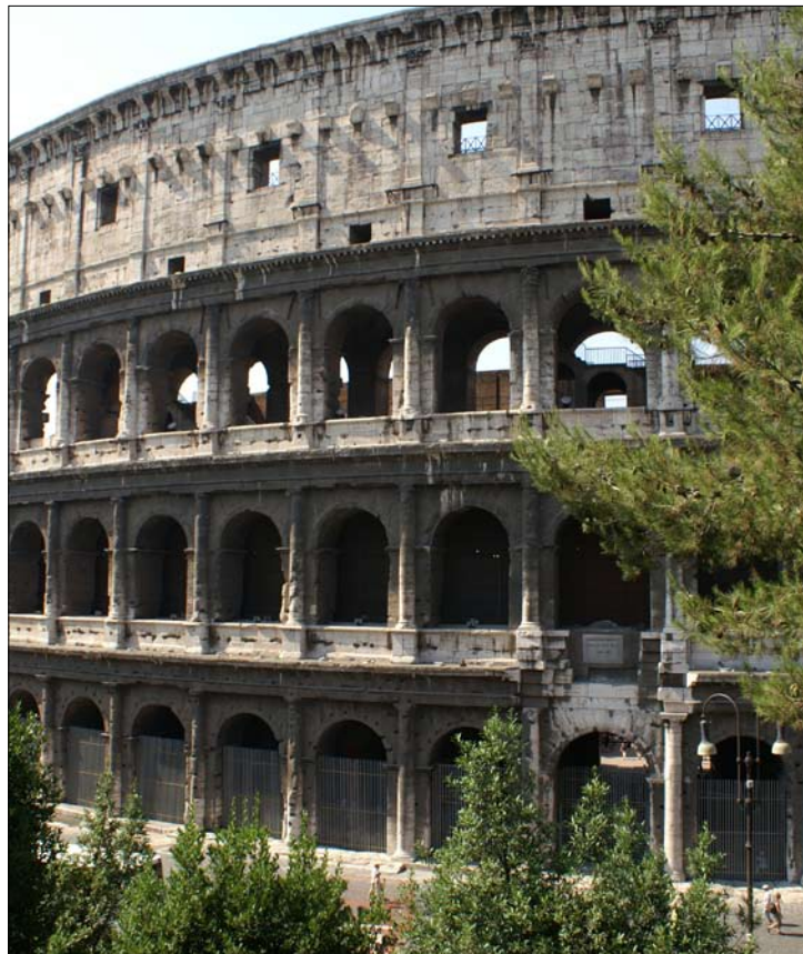
Rooman Colosseumin hiekkaa värjäsi satojen tuhansien kristittyjen veri monien vuosikymmenien ajan.