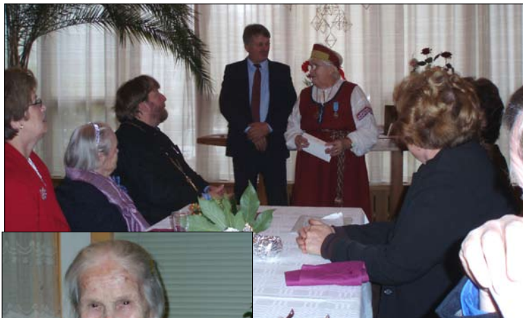
Tervolainen Nasti Tuutti juhli 90-vuotispäiväänsä samalla päivänä, kun Profeetta Eliaan tsasouna vietti viisikymppisiä.