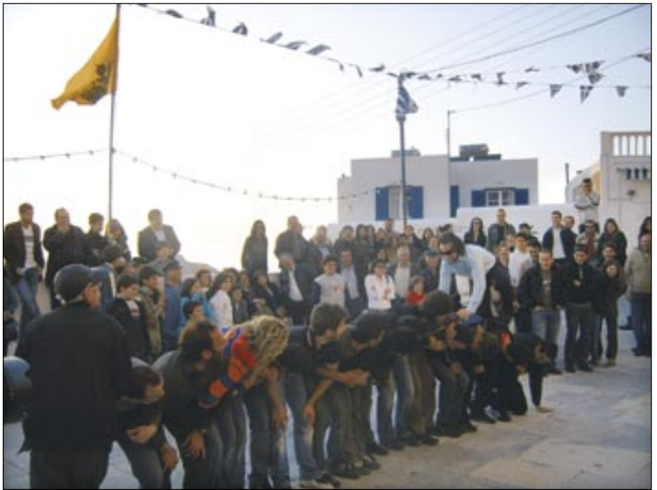
Seuraleikkejä kirkon pihalla

Kuten monessa paikassa Kreikassa, on tälläkin saarella luostarinsa, jossa on ih-