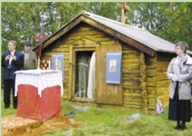
Pyhän Georgioksen kappeli Norjan Neidenissä

Pyhien Sergein ja Hermanin Veljeskunta ry ja Joensuun ortodoksinen seurakunta järjestävät perinteisen pyhiinvaellusmatkan maamme pohjoisimmille