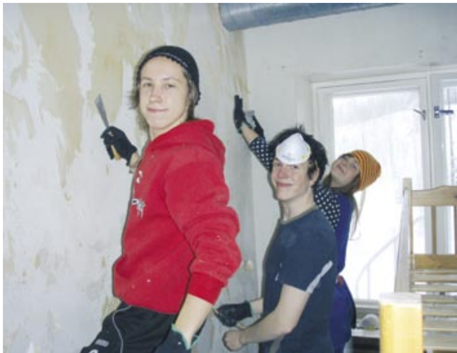
Alkutaalven kuvasatoa: Reippaita tapetin poistajia Sikrenvaaran työleirillä. Tässä vaiheessa vielä hymyilyttää!

Huom! Omat pajut mukaan, koristeita löytyy sitten talon puolesta.