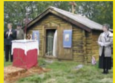
Pyhän Georgioksen kappeli Norjan Neidenissä

TULE MUKAAN PYHITTÄJÄ TRIFON PETSAMOLAISEN JUHLAAN LAPPIIN 26-30.8.2010