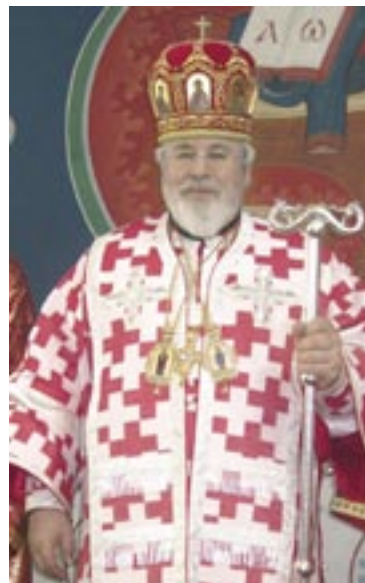
Karjalan ja koko Suomen arkkipiispa

Pääsiäisen ilo on kasvamista pieneksi ja vilpitöntä uskoa nähdä miten ”Tämä on se päivä, jonka Herra teki, iloitkaamme ja riemuitkaamme tänä päivänä” (Ps 118:24).