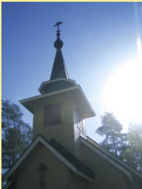
Valtimon kirkko.

ep= ehtoopalvelus, ap= aamupalvelus, EPL= ennenpyhitettyjen lahjain liturgia