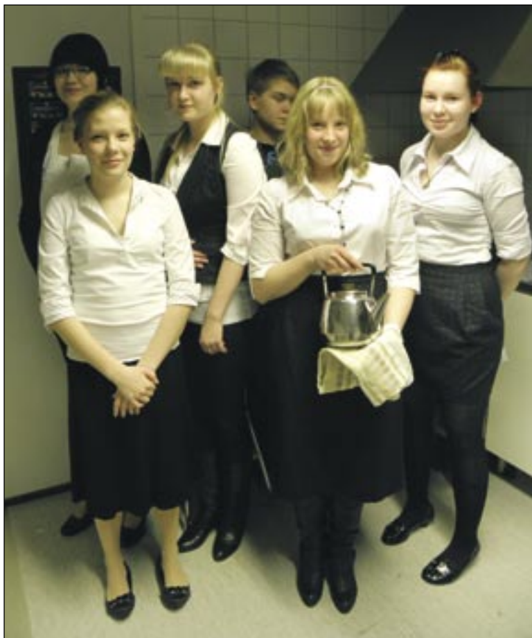
Ilomantsin nuortenpiiriläisiä kahvitamassa 2.3. seurakuntaillassa.

Kirkkolaulupiiri kokoontuu pyhän Elian kirkossa joka toinen keskiviikko klo 16.45–17.45, jonka jälkeen toimitetaan yhdessä ehtoopalvelus klo 18.00. Tänä keväänä kokoontumisia vielä 21.4, 5.5. Helatorstain aattona 12.5 lauletaan ehtoopalvelus Huhuksessa. Kirkkolaulupiirissä lauletaan yksinäisesti sekä tutustutaan kirkkolaulun teoriaan ja laulamisen perusteisiin. Piiri on kaikille avoin, eikä esiinny. Uudet kiinnostuneet aina tervetulleita! Piiriä ohjaa kanttori Riikka