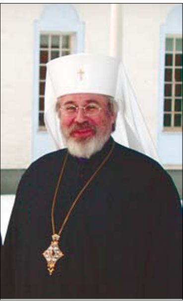
olkoon meidänkin ylistyksemme ja kiitoksemme.