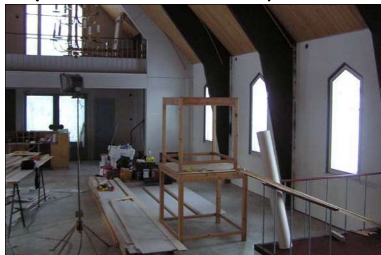
Kristuksen kirkastumisen tsasounassa on kunnostustyöt käynnissä. Kirkkosali on valmis jo suuren viikon jumalanpalveluksissa.

Remontti jatkuu alkeuskäytölle tsasounan ulkomaalauksella ja uusien ikonien ja kalusteiden asentamisella.