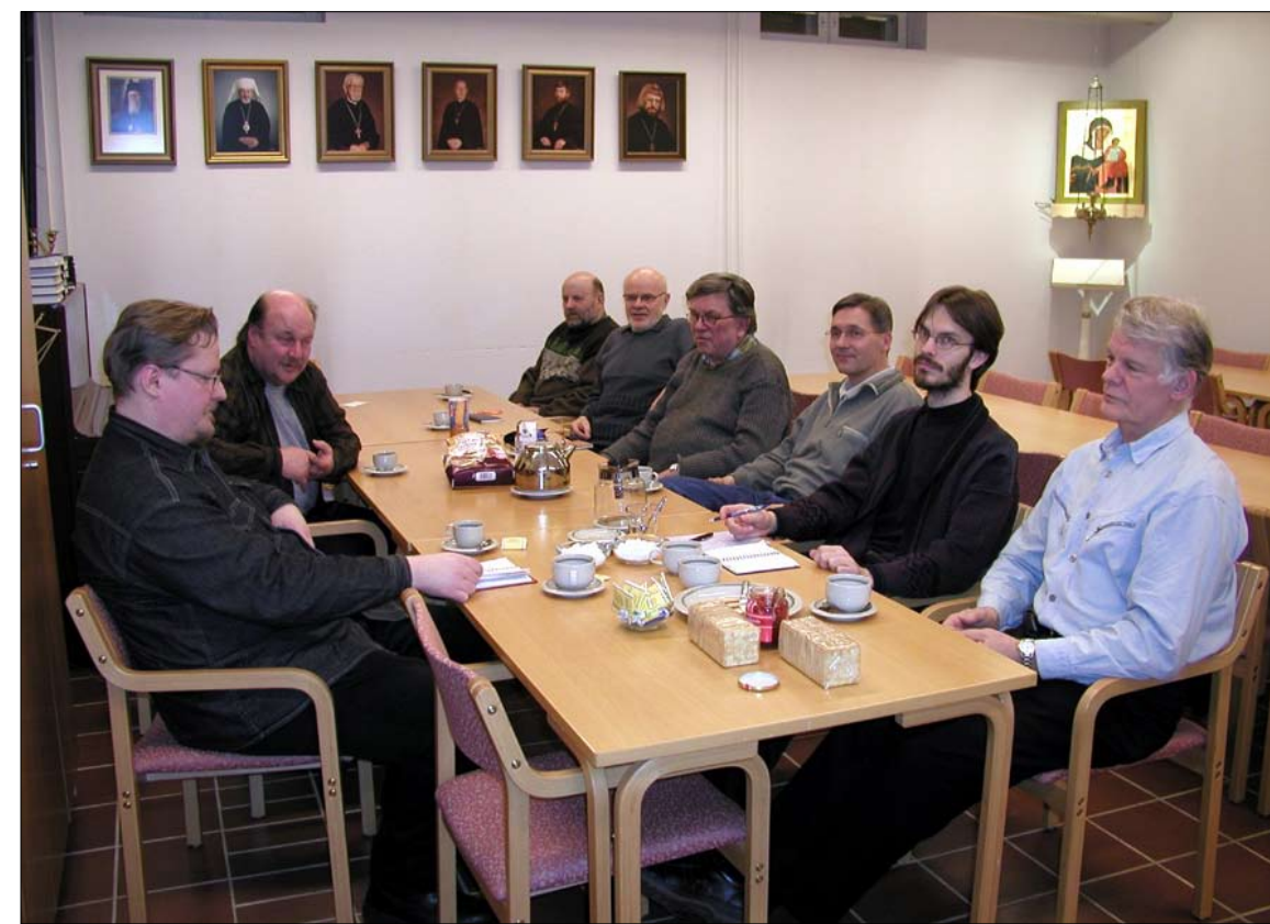
Nikolaoksen miehet aloittivat Kuopiossa tämän vuoden alussa. Kuvassa miehet koossa Pappilan talon alakerrassa pohtimassa kevään ja syksykin toimintoja.asiat ovat varsin toiminnallisia ja käytännöllisiä. Kaikenlaista tekemistähän seurakunnassa aina on eikä vain Kuopiossa vaan muallakin. Seuraava tapaaminen on 19. huhtikuuta.

Pielaveden kirkon saneerauksen suunnittelusta tehdään päätös myös kevään kuluessa. Ratkaisu on merkittävä ja sen pohdinta onkin sekä kiinteistölautakunnan että neuvoston listoilla varmaan useammankin ker-