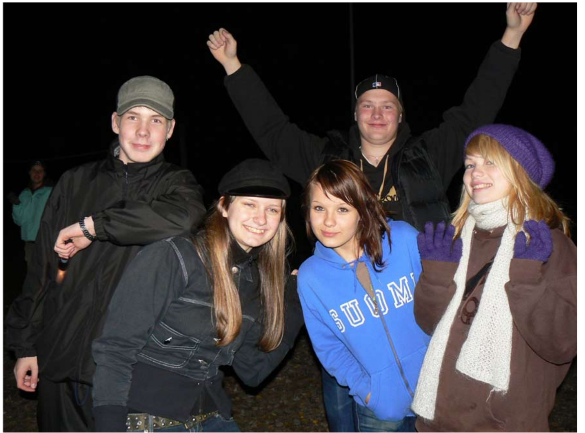
Kesän kolmen kristinoppileirin yhteinen jatkokleiri järjestettiin Pyhäkankaalla 14.-16.9.2007. Mukavan menon ja yhdessäolon merkeissä viikonloppua vietettiin Iisalmen, Jyväskylän, Kuopion ja Mikkelin seurakunnista saapuneiden nuorten kesken.