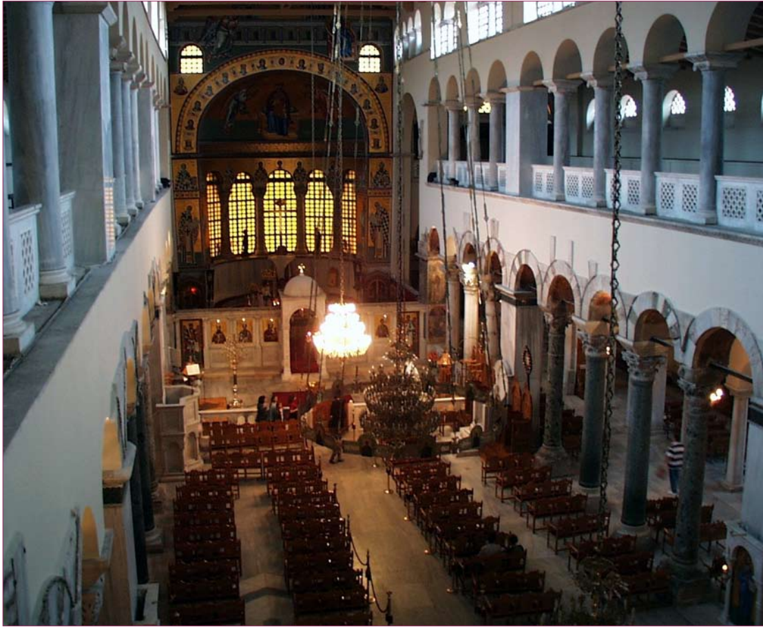
Tessalonikissa sijaitseva Pyhän Demetrios Mirhavuodattajan kirkko edustaa kreikkalaisen perinteen mukaista kirkkorakennusta. Kirkossa on tuolit ja selkeät käytävät, joita pitkin papisto tekee pitkät saatot lasten seurattessa heitä.

tystä, joka johti Kristuksen syntymään. Ihmiskunta ei olisi voinut tuoda puhdasta neitsyttä joululahjana Jumalalle, ellei Maria itse olisi valmistautunut koko siihenastisen elämänsä ajan juuri tuohon suureen tehtävään.” Lue lisää osoitteesta www.ortodoksi.net/kirkkovuosi