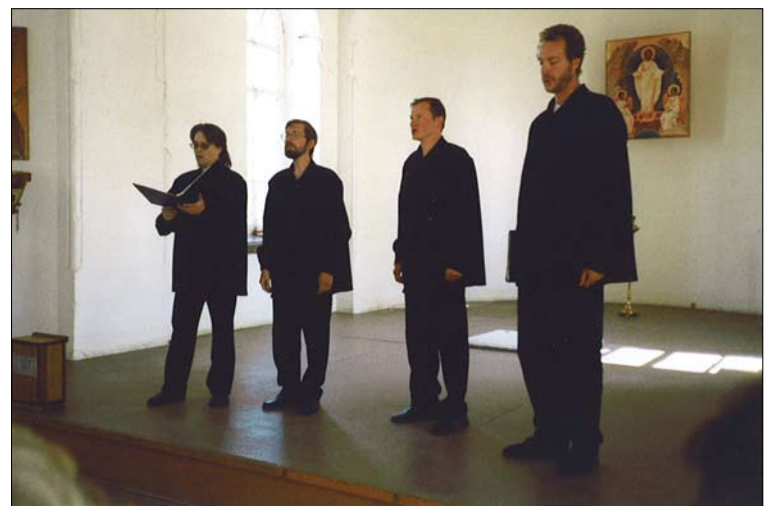
Laatokan Valamon laulajista koottu kuoro konsertoi Kuopion seurakuntasalilla 24. lokakuuta klo 18 alkaen.