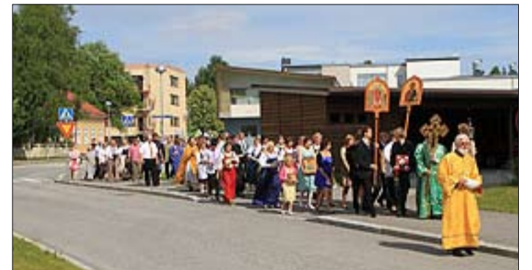
Evakon pruasniekan ristisaattoon osallistui noin 200 vaeltajaa.

Kuutosseurakuntien Kultaisen iän leiri Valamon luostarissa 30.9. – 1.10.2010. Ilmoittautumiset 15.9 mennessä seurakunnan kansliaan puh. 017-817441.