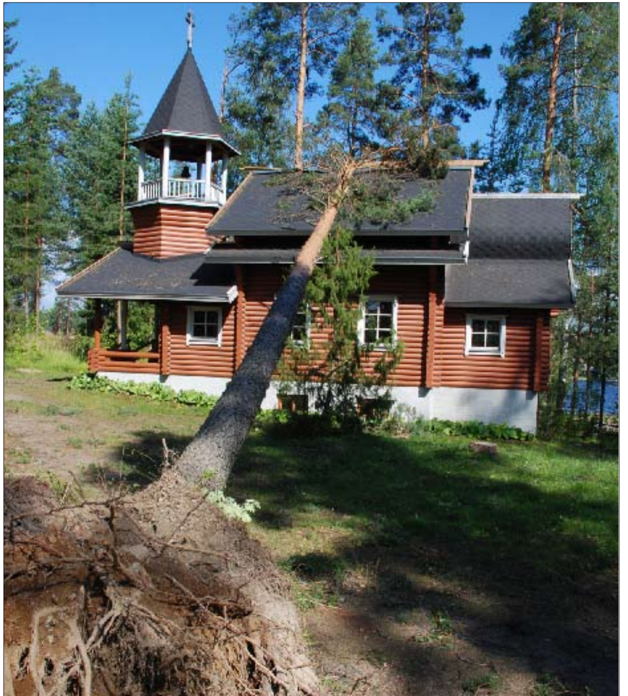
Asta-myrsky kaatoi puun Kristuksen kirkastumisen tsasounan katon päälle. Tsasouna on rakennettu vuonna 1989.