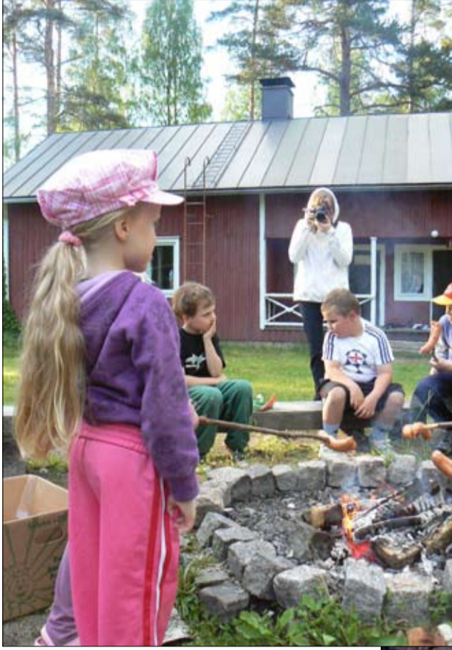
Lastenleiri pidettiin Pyhäkankaalla 15.-18. kesäkuuta.