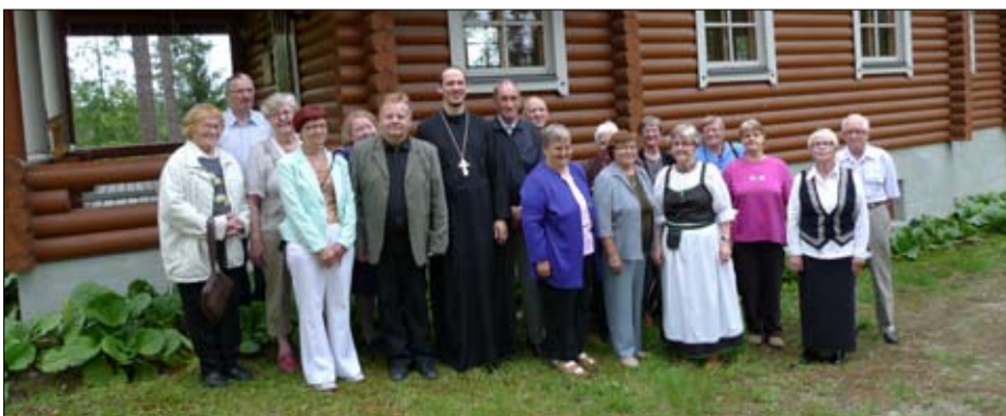
Viitasaaren tsasounalla vietettiin Kristuksen kirkastumisen praasnietkaa 5.-6. elokuuta.