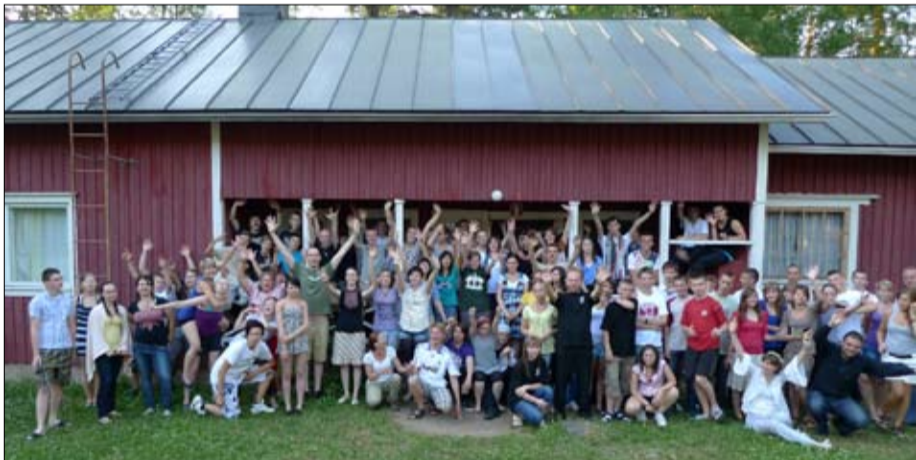
Puolalainen nuorisoryhmä oli Jyväskylän seurakunnan vieraana 3.-4. heinäkuuta. Kuvassa yhteiskuvassa Pyhäkankaalla ulkomaiset vieraat ja I kristinoppileiriläiset.