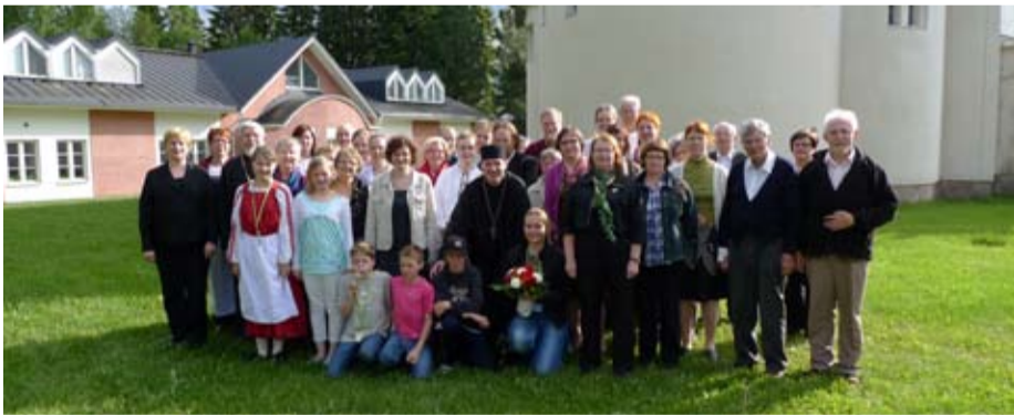
Jyväskylän iloiset matkalaiset vierailulla Valamossa paluumatkallaan kirkkopäiviltä Joensuusta 13. kesäkuuta.