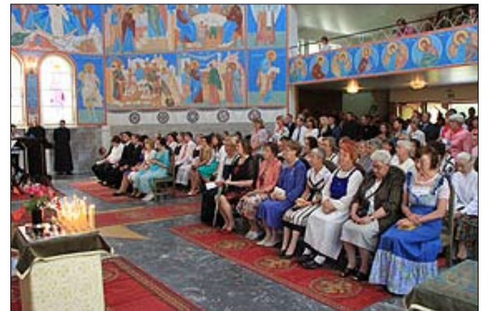
Pr. Elian kirkko täyttyi tungokseen saakka Evakon prusaniekan ja kristinoppikoulun juhlaväestä 18.7.