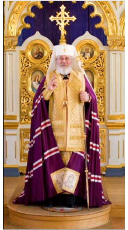
Kirkkivuoden alkupuolelle ajoittuu yksittäinen paastopäivä, Ristin ylen-tämisen juhla. Sitä vietetään 14.9. Paaston liturginen väri on violetti.