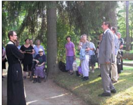
Seurakuntalaiset lähdössä kiertämään omaistensa hautoja.