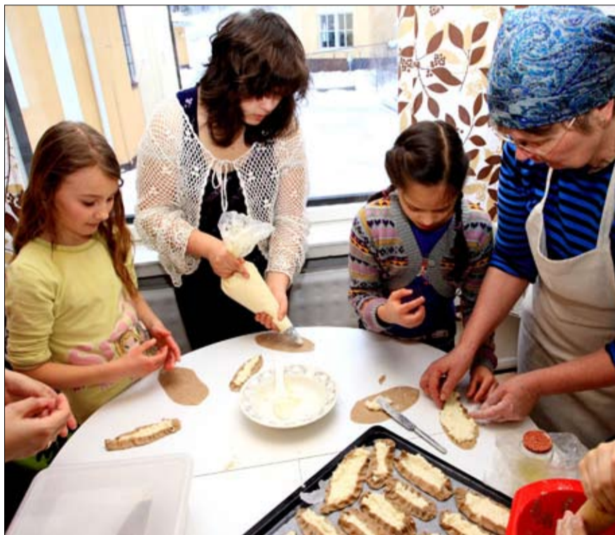
Jyväskylän ortodoksisen nuoret ja lasten ryhmä yhdisteli pizza- ja piirakkaperinnettä.