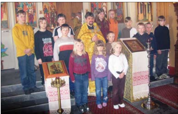
Siilinjäven koululaisia oli kirkossa viettämässä sm. Georgios Voittajan praasniekkaa.