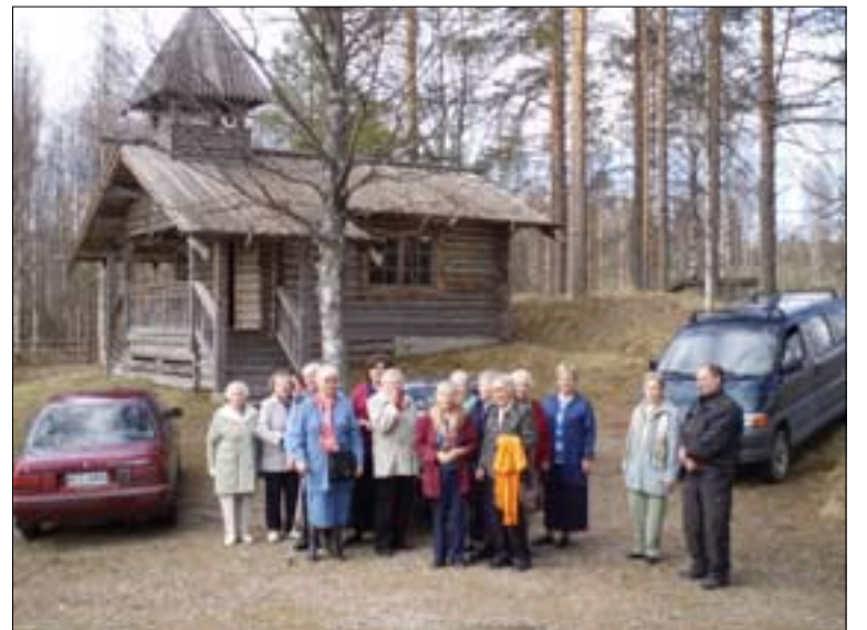
Varkauden tiistaiseuran Virikkeen väki osallistui Kevät-Miikkulan pruasniekkaan Tuupovaaran Hoilolassa. Retkellä he tutustuivat yli Saarivaaran tsasounaan.