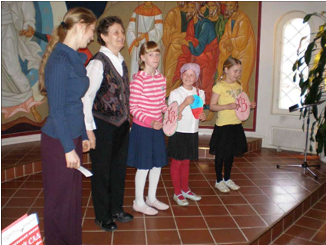
Детский кружок «Родничок» дружно провозгласил пасхальное приветствие ХРИСТОС ВОСКРЕС! 6.5.07.