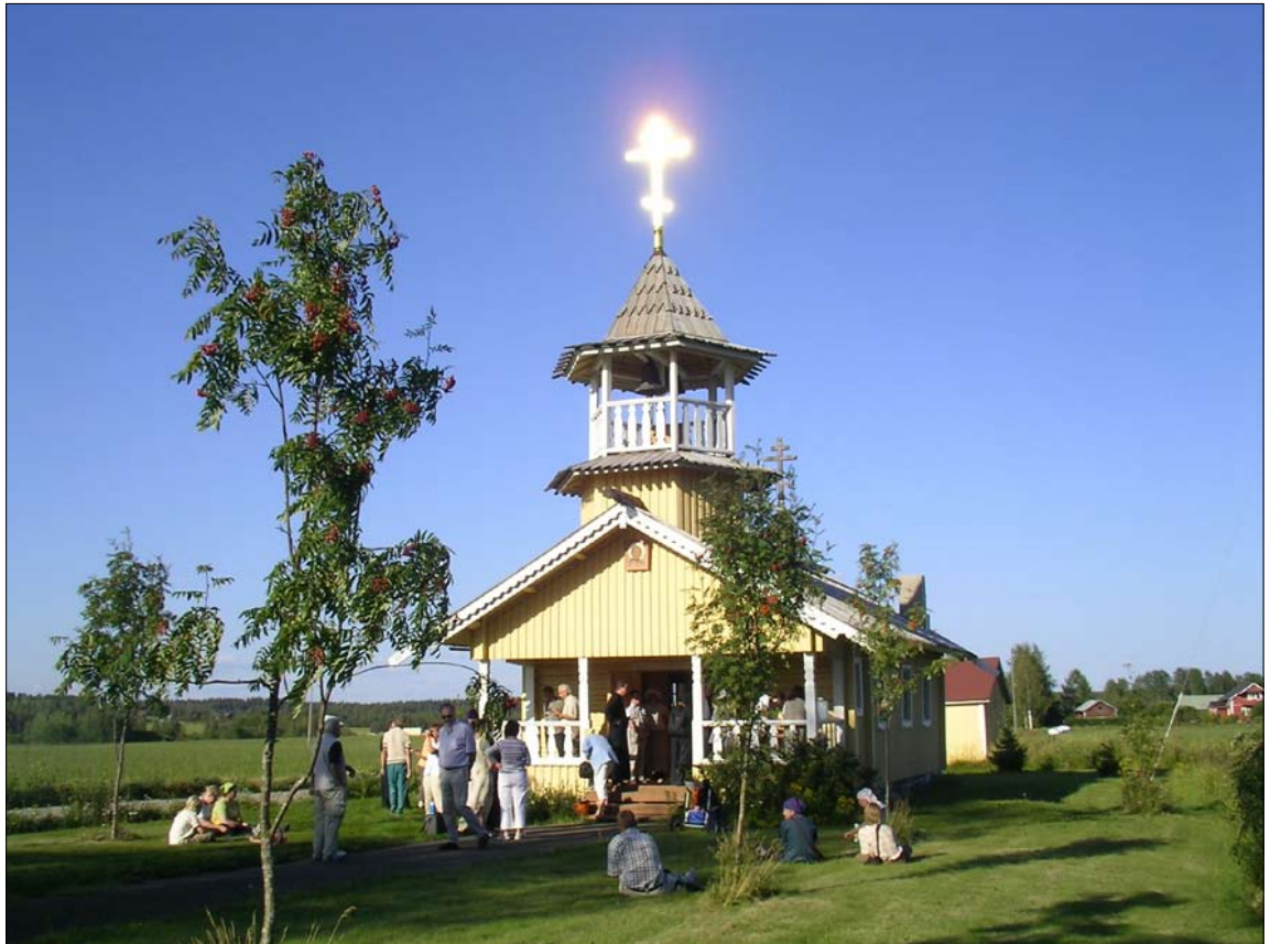
Alapitkän tsasouna täyttää toukokuun lopussa 60 vuotta.