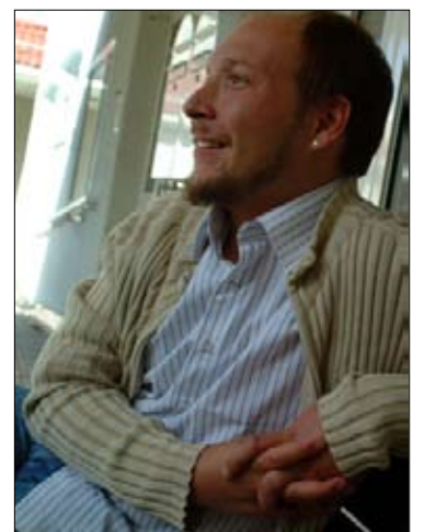
Antti nuorisotyöhön ja...

Ilmoittautumiset 15.6. mennessä seurakunnan virastoon p. (017) 2882 300 (ma-pe klo 9-12).