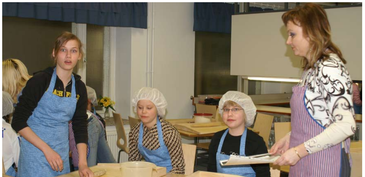
Kalevalan koulun piirakanpaistajien apuna oli Kuopion karjalaisia martoja. Monikulttuurisen koulun oppilaat tutustuivat karjalaisuuteen leipomalla.