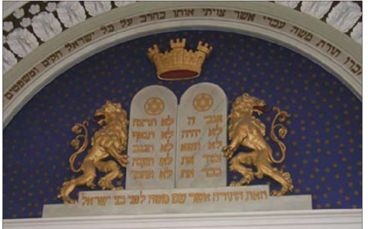
Kymmenen käskyä hebrean kielellä voi käydä lukemassa muun muassa Helsingin synagogasta.

Islamin usko nosti naisen asemaa Arabian niemimaalla, jossa aikaisemmin tyttövauvoja tukahdutettiin hiekkaan heti syntymän jälkeen.