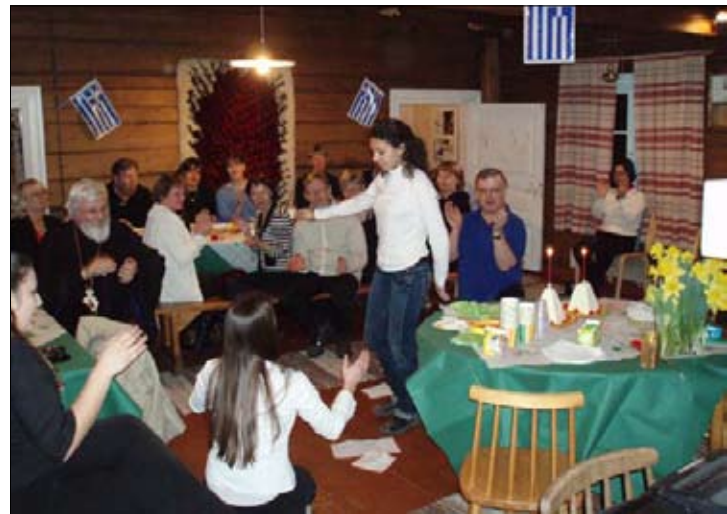
Nuoret kreikkalaisvieraat esittivät pääsiäisyönä kreikkalaisen tanssin Inkilänmäen Tätilän-perinteikkäässä tuvassa.

Kirjoitus on jatkoa Solean edellisessä numerossa sivulla kaksi olleeseen kolumniin.