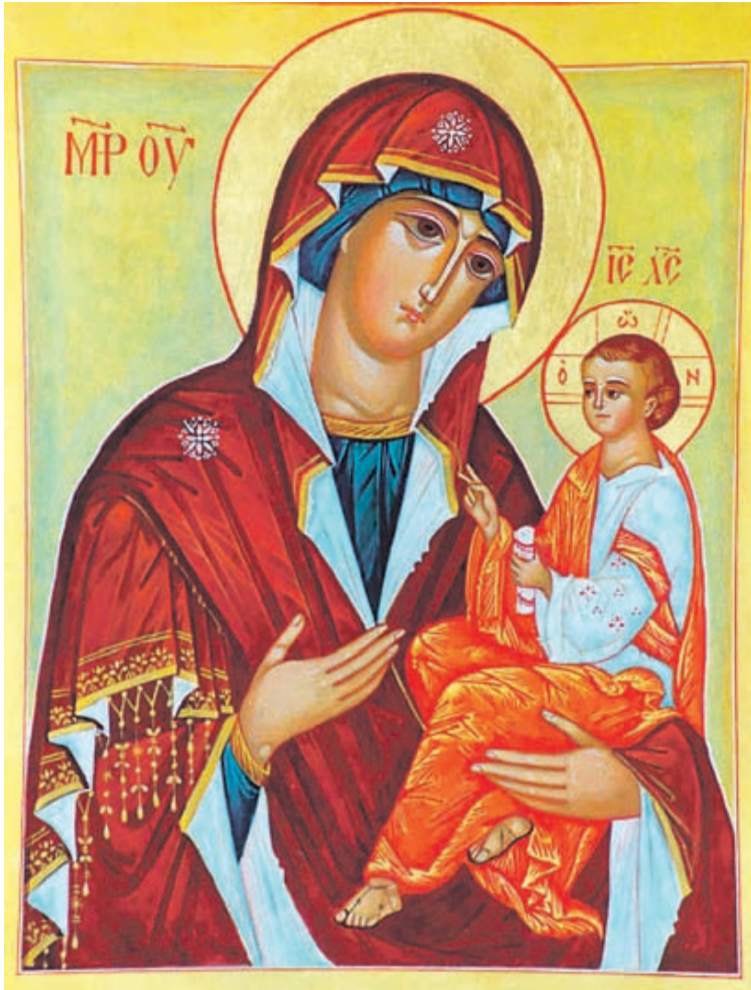
Tiennäyttäjä. Oulun ortodoksinen seurakunta.