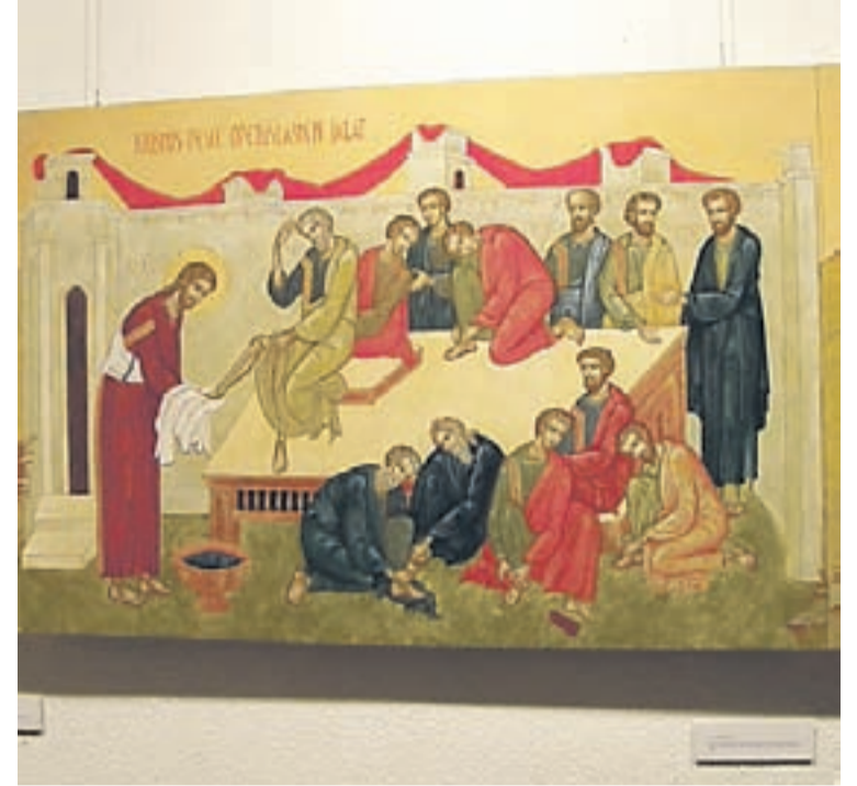
Kristus pesee opetuslasten jalat.