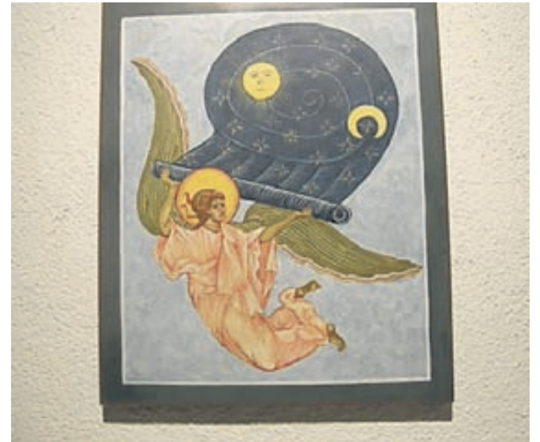
Enkeli levittämässä taivaankantta.