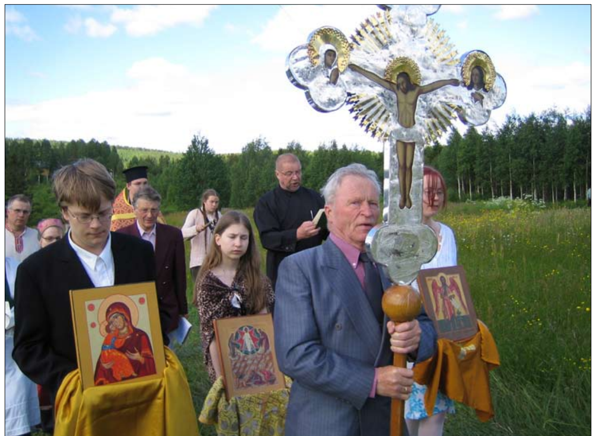
Valtimon Rasimäki on prosentuaalisesti Suomen ortodoksinen kylä. Rasimäelle kannattaa matkustaa Johannes Kastajan praasniekkaan ensi kesänä. (kuva: Antti Narmala)

Lisätietoja juhlasta ja majoituksesta yms, Nurmeksien ortodoksisesta seurakunnasta, khra Andrei Verikov 040-7458258.