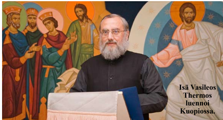
Isä Vasileios Thermos luennoi Kuopiossa.

vain ulkoinen tapahtuma, jonka vaikutus ei kestä pitkään. Kun katumuksen aiheuttaa rakkaus, se muuttaa ihmisen ja kestää.