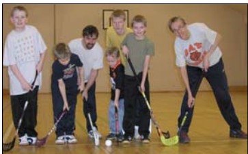
Kuopiossa kokoontuu maanantaisin pirteä sählykerho. Mukaan sopii uusia pelaajia! Ota yhteyttä seurakuntaan.