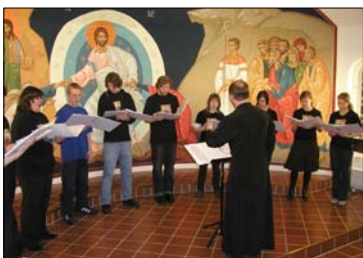
Kuopion Pyhän Nikolaoksen katedraalin nuorisokuoro konsertoi ahkerasti.