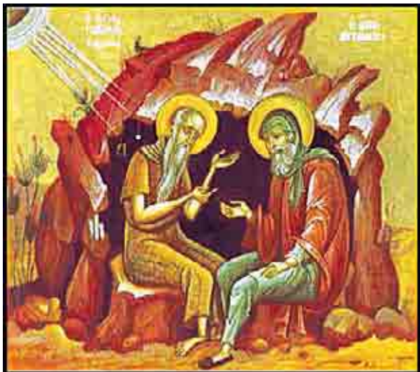
Paavali Ensimmäinen Erakko (vas.) ja Antonios Suuri, kaksi suurta autiomaassa kilvoittelevaa isää kohtaavat toisensa.

Antonios oli syntynyt varakkaasta egyptiläisestä perheestä mutta halusi kirjaimellisesti noudattaa Kristuksen sanoja ” Jos tahdot olla täydellinen, niin mene ja myy kaikki, mitä sinulla on, ja anna rahat köyhille. Silloin si-