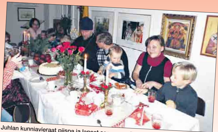
Juhlan kunniavieraat piispa ja lapset samassa pöydässä.