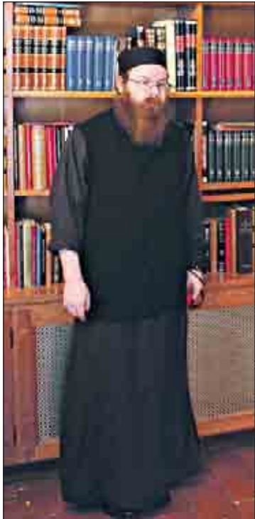
Munkkidiakoni Vasiliosen kilvoitustehtävänä on toimia Kykkon luostarin kirjastohoitajana.

Hotellimme oli Pafoksen kaupungissa, josta linnuntietä Kykkoon on noin 50 km, ja kuvitelimme kartan perusteella olevan helppoa ”piipahtaa” luostarissa. Totuus paljastui vasta perillä. Bussit eivät kulje Pafoksen ja Kykkon välillä, taksi matka maksaa hunajaa ja vasemmanpuoleinen liikenne arveluttaa auton vuokrauksessa.