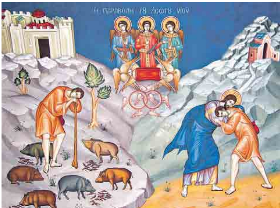
Ikoni kuvaa Jeesuksen vertausta tuhlaajapojasta. Vasemmalla toivoton tuhlaajapojika ja oikealla Kristus itse ottamassa katuvan syntisen rakkaudella vastaan. Keskellä on kuvattu enkeleiden ympäröimä Jumalan valtaistuini. Se on tyhjä sillä Kristus on lähtenyt vastaan tuhlaajapojakaa.