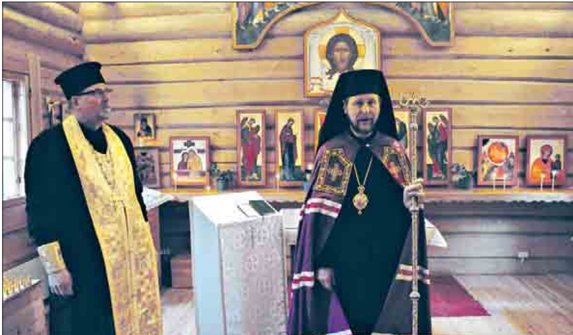
Pietarsaaren pyhäkön tunnelma oli iloinen ja sosiaalinen, jossa käytiin paljon vilkasta keskustelua.