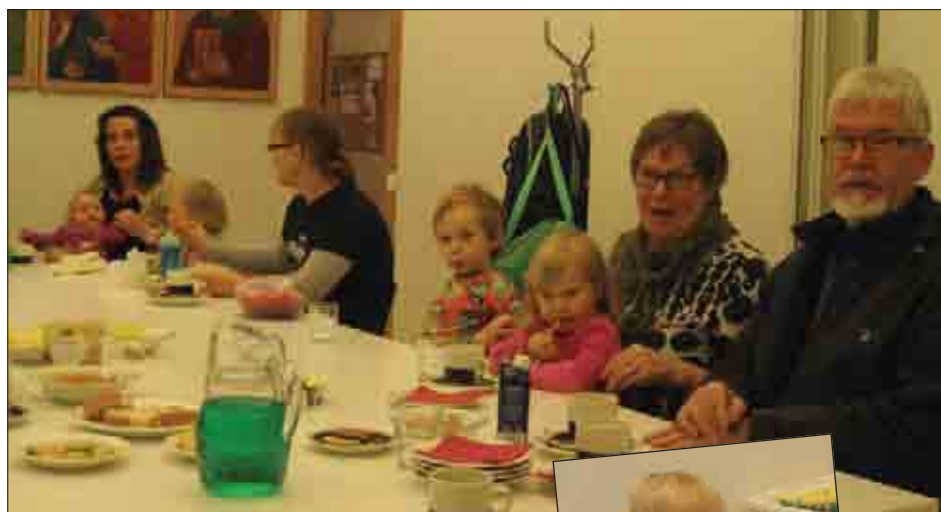
Tuokiokuvia Oulun perhekerhosta syksyllä 2013.