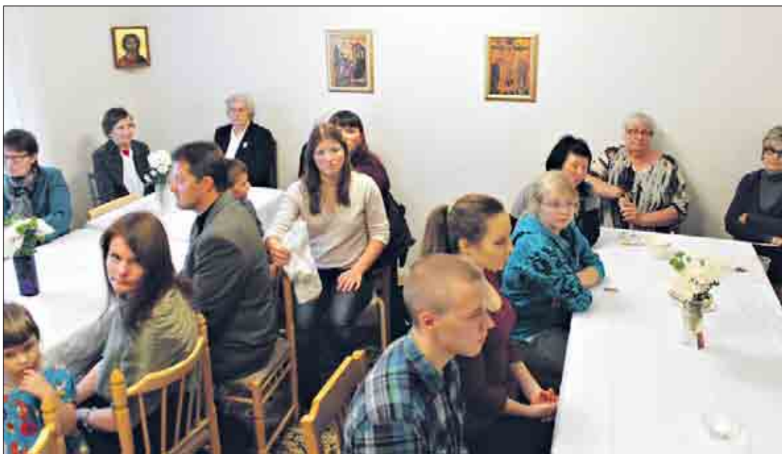
Lapuan tsasounan yhteydessä oleva pieni seurakuntakoti oli täynnä. Liturgian jälkeen juotiin kirkkokahvit ja iloittiin aktivoituneesta pyhäkköalueesta.