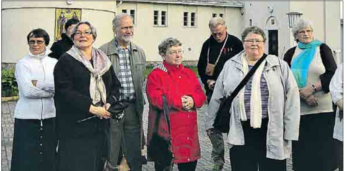
Uudessa Valamossa Heinävedellä tehtiin opastettu luostarikierros, jonka alkamista osa matkalaisista on tässä odottelemassa.