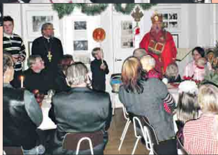
Pyhä Nikolaos toi pikkulahjat lapsille.