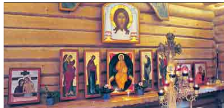
Pyhien profeetta Elian ja pyhän Annan tsasouna.