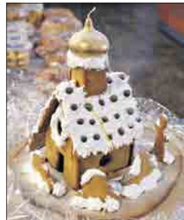
Kokkien loihtima piparkakkukirkko. Kuva Valamon luostarista.