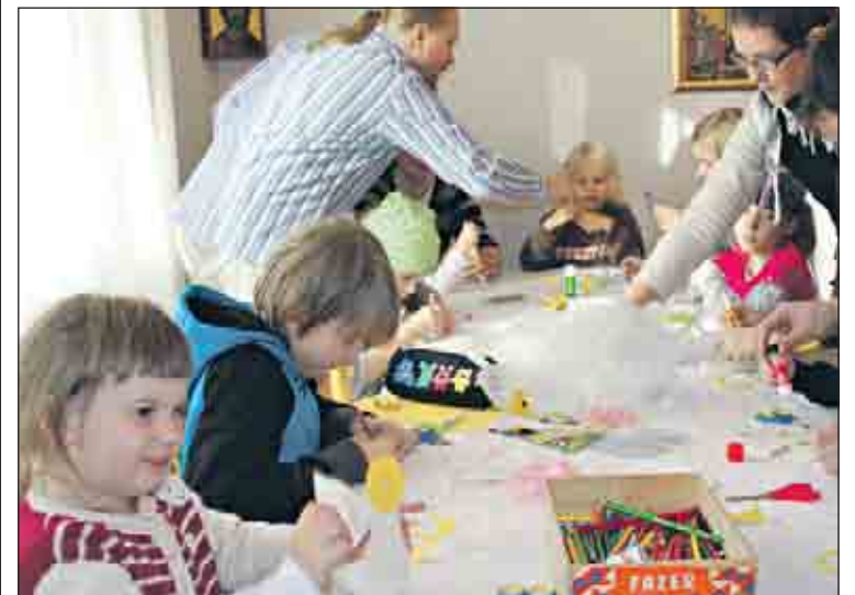
Sunnuntaina 13.10.2013 järjestettiin Lapualla perhetapahtuma kaikille Vaasan seurakunnan 0-12 vuotiaille lapsille. Tapahtumaan osallistui 15 lasta. Tapahtuman teemana olivat enkelit. Kuvassa askarrelaan enkeliteemaan liittyviä asioita.