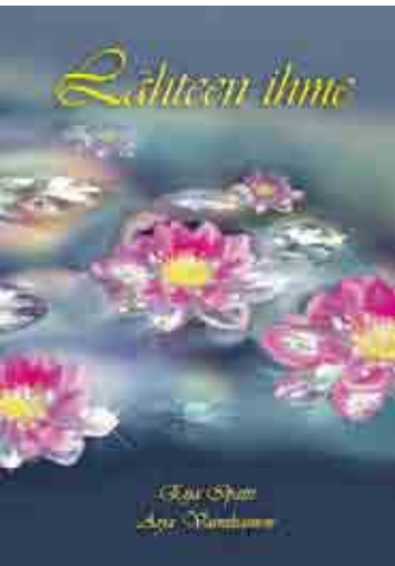
Satukirja lapsille. Kirjoittanut Eija Ipatti. Kuvitus Arja Vainikainen. 47 sivua.

"Eräänä päivänä ympäristö alkaa voida huonosti. Pieni lähde ja satumetsä joutuvat kär-