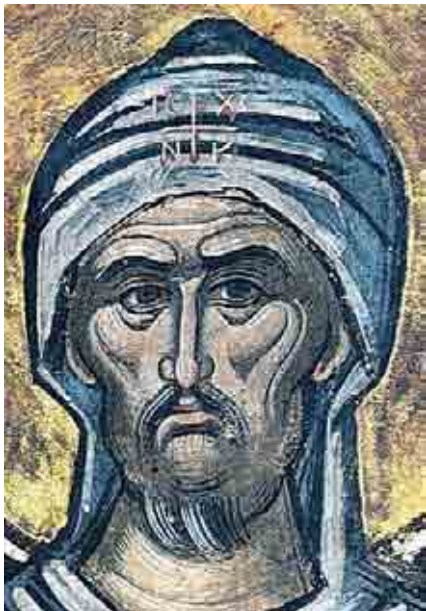
Pyhän Efraim Syyrialaisen suomenkielisessä paastorukouksessa anomme: "... estä minusta laiskuuden, velttouden ja turhanpuhumisen henki."

Lapin sinihohtoinen kaamos on juuri nyt parhaimmillaan, joulupaasto lähestyy loppuaan ja odotamme innolla Kristuksen syntymäjuhlaa. Syystalven aikana olemme viettäneet seurakunnassa monia mukavia tapahtumia ja ihania yhteisiä hetkiä; erilaiset tapahtumat, ikoninäytely, hiippakuntapäivät ja pe-