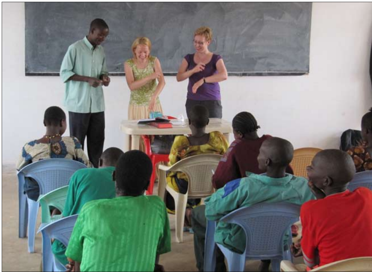
Ortodoksinen Lähetyksen ry:n tiimi koki Luoteis-Tansaniassa pyhän läsnäolon ihmisten kohtaamisen kautta.