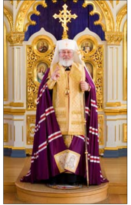
Paaston liturginen väri on violetti. Joulupaasto alkaa 15. 11. ja se kestää jouluaattoon 24.12. asti.