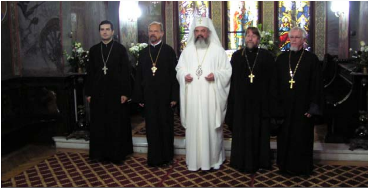
Kuutosten kirkkoherrot - isä kävi Romaniassa syys-lokakuun vaihteessa.