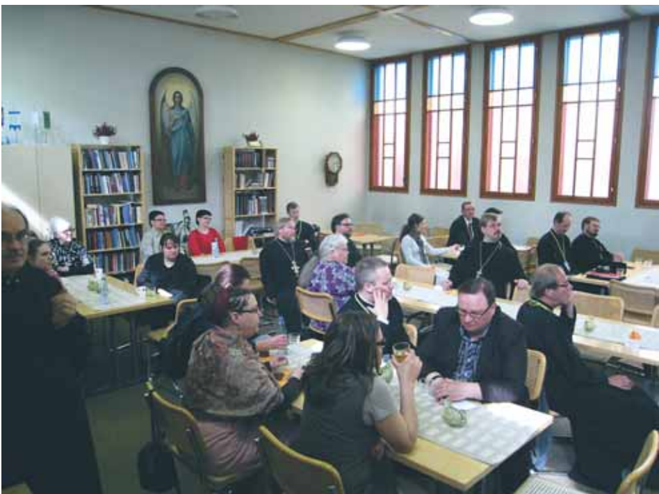
Hiippakuntaneuvosto ja hiippakunnan työntekijät osallistuivat yhdessä Vaasan hiippakuntapäivien "Kirkko ja nuoret" -seminaariin 14.5.2011. Tämän lisäksi hiippakuntaneuvosto piti oman erillisen kokouksensa, jossa se pohti mm. Oulun ortodoksisen hiippakunnan seurakunnille yhteistä toimintastrategiaa.