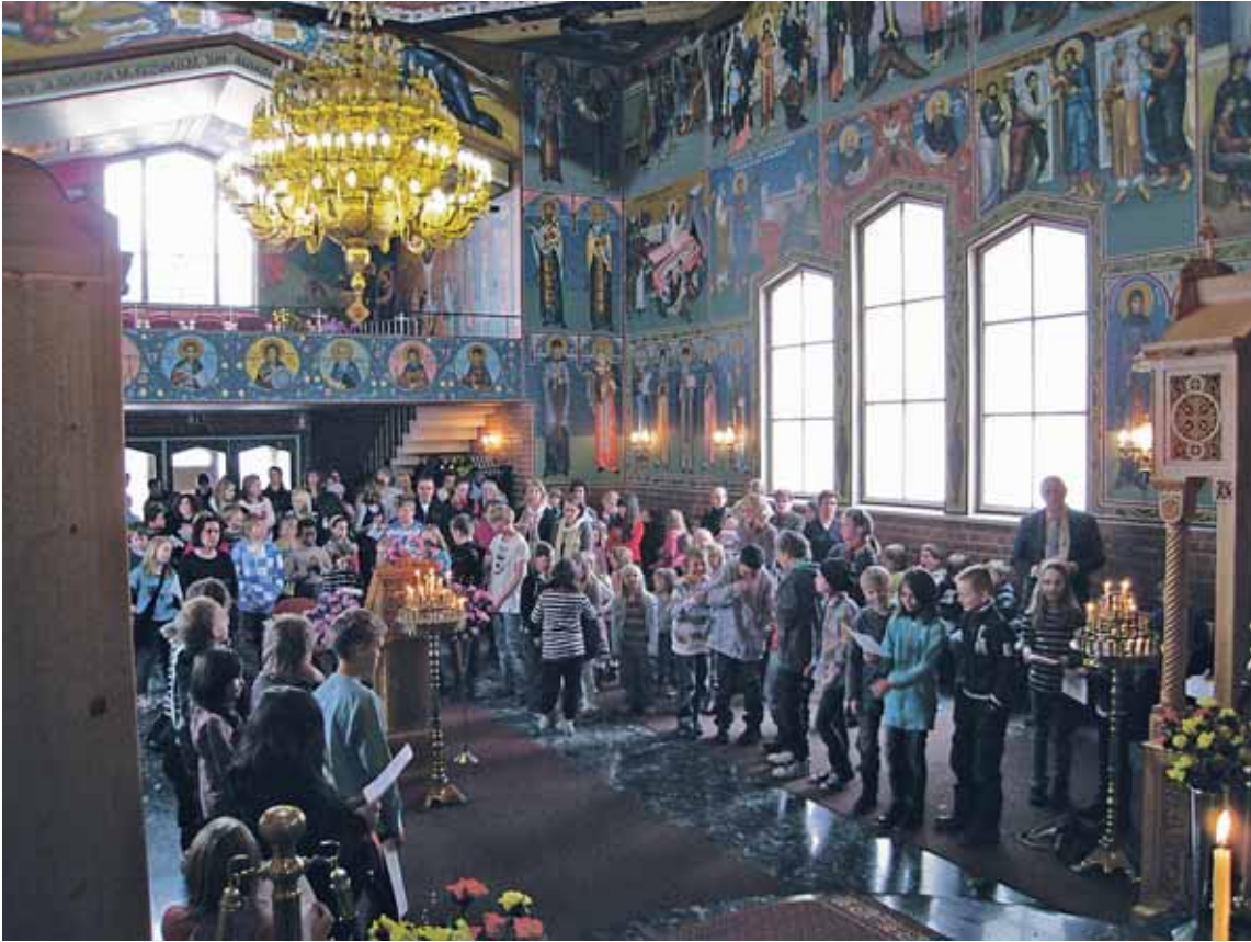
20.4.2011 Suuren viikon koululaisjumalanpalvelus keräsi Kristuksen kirkastumisen kirkkoon Kajaaniin runsaasti lapsia ja nuoria.