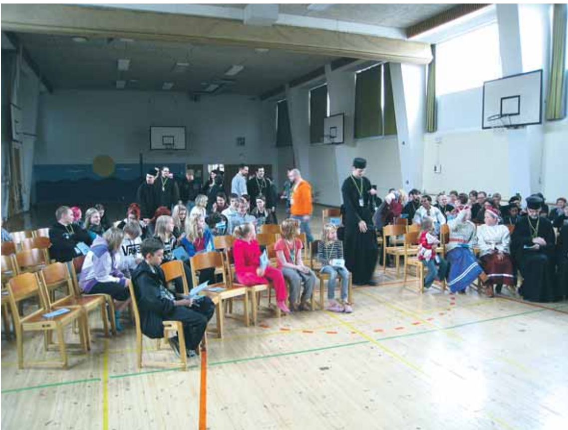
Ortodoksisen nuorten liiton (ONL) vuosijuhlien ohjelmasta osa vietettiin Vaasan Merenkurkun koululla.