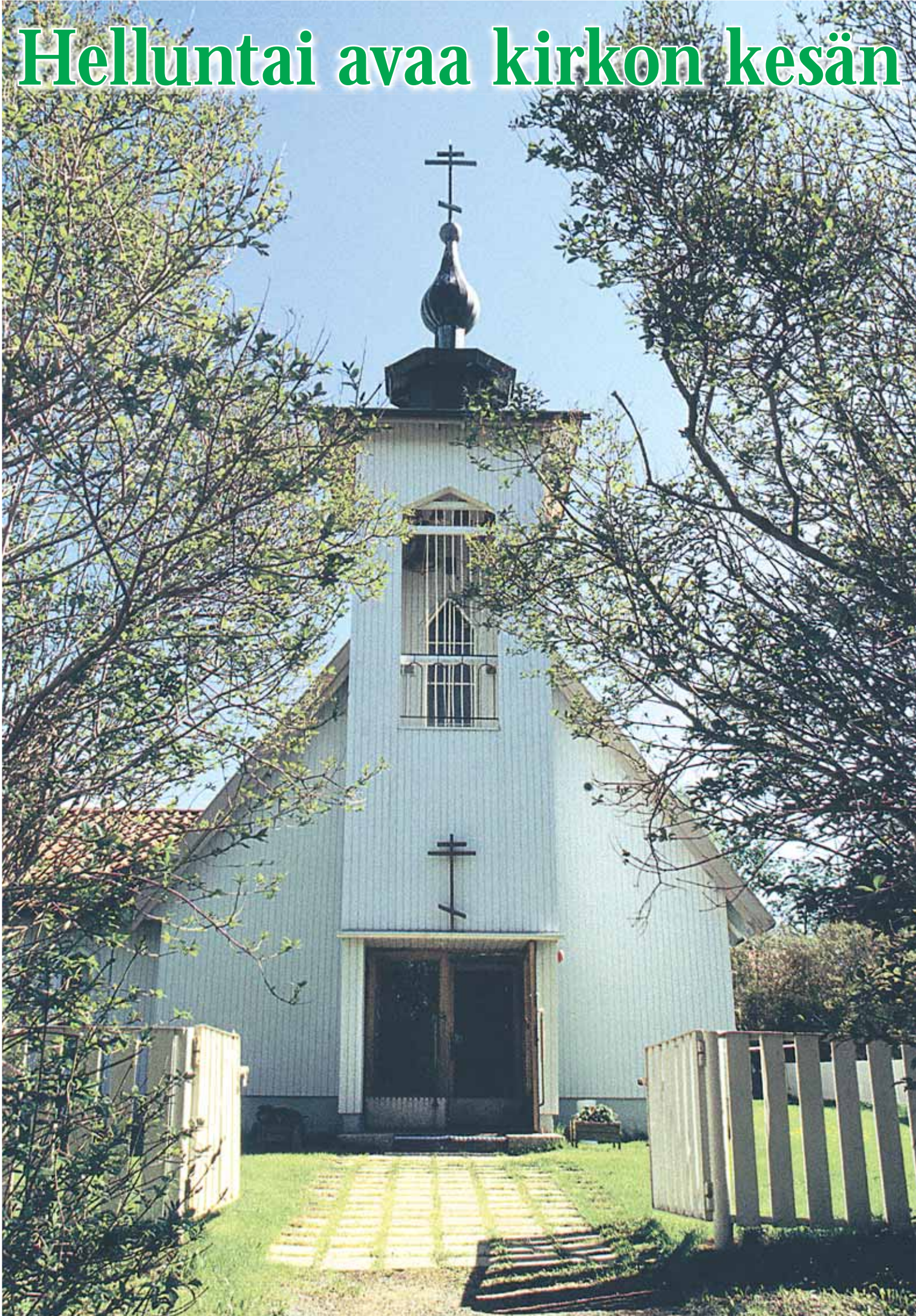
Pyhän Johannes Kastajan kirkko Kemissä.