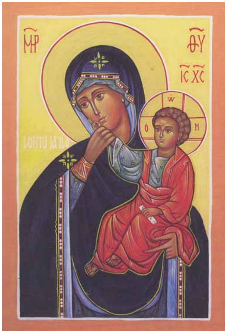
Hellyys-ikoni. Kirjan kuvitusta.

Kirja on jaettu aihepiireittäin viiteen osaan: Kristuksen, Jumalanäidin, profeettojen ja ilosanoman julistajien teemoihin. Lisäksi kirjassa esitellään kirjan tekijöiden omat taivaalliset esirukoilijat, esiäiti Eeva, pyhä apostolinvertainen Mariamne, pyhä marttyyri Filadelfos Sisilialainen ja pyhä apostoli Tuomas. Ortodoksinen käytäntö, jossa kasteessa saatu nimi on johdettavissa aiemmin eläneeseen pyhään ihmiseen, on tuotu hyvin esille, ja esirukoilijoiden merkitys taivaallisina tukijoina on lämpimästi selitetty.