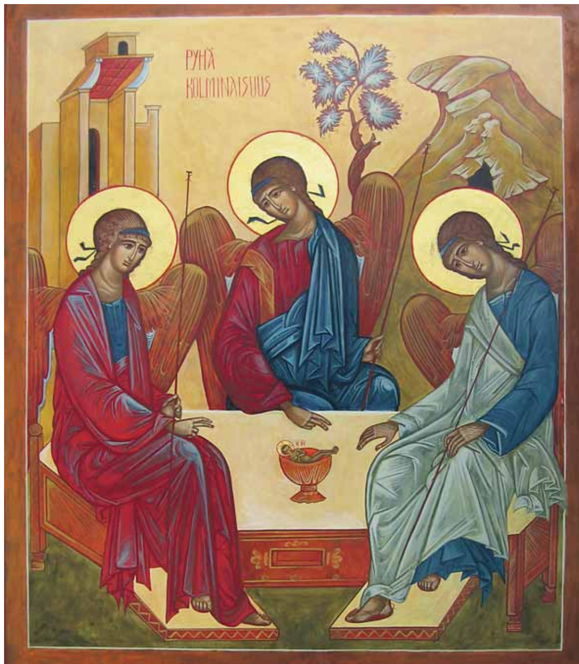
Pyhä Kolminaisuus.

Pyhä Johannes Krysostomos luonnehtii elävää uskoa ”kaikkien hyvien asioiden äidiksi”. Hänelle jumalanpalvelus perustuu erottamattomasti Kristuksen kirkolle jättämän lähetystehtävän (Matt. 28:19-20) toteuttamiseen maailmassa. Jumalanpalvelus tekee todelliseksi uskovien elämässä kirkon ilon.