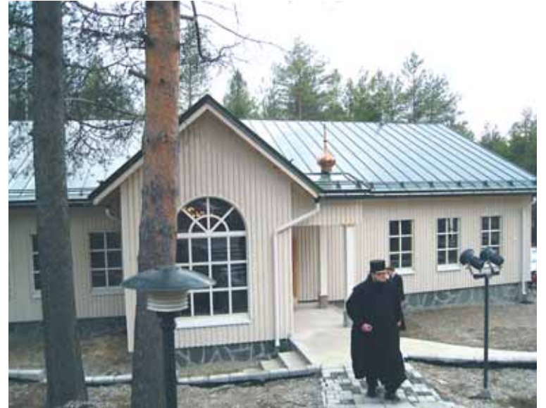
Lapin seurakunnan Rovaniemellä sijaitseva Petsamo-sali vihittiin käyttöön 21.5.2011. Tilaisuuteen osallistui runsaasti väkeä. Uuden seurakuntakeskuksen valmistuminen sai runsaasti huomiota myös paikallisessa mediassa.