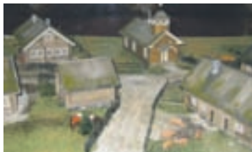
Salmin Kaunoselän kylän pienoismalli. Taustalla Pyhän Nikolaoksen tsasouna.

La 11.2. klo 17 Pr Elian kirkko + vigilia Ma 27.2. klo 17 Pr Elian kirkko + ehtoopalvelus La 4.3. klo 17 Pr. Elian kirkko + vigilia La 18.3. klo 17 Pr Elian kirkko + vigilia Tervetuloa!