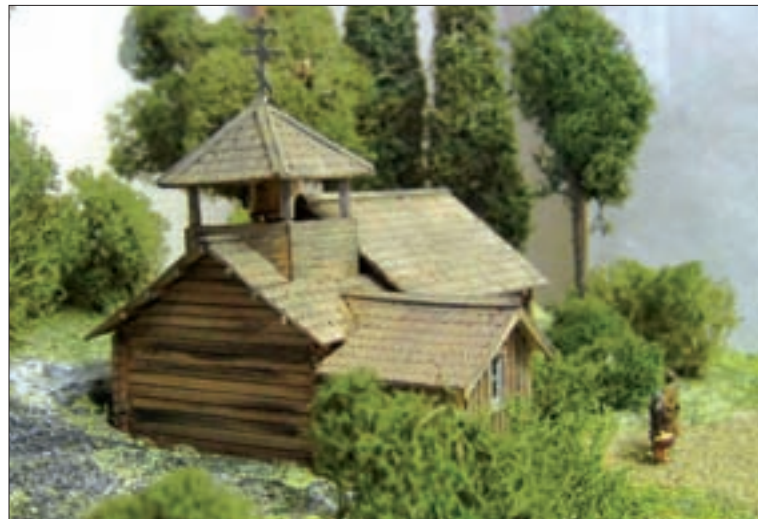
Suistamon Leppäsyryn Pyhän Georgioksen tsasounan pienoismalli löytyy Iisalmesta Evakkokeskuksesta.