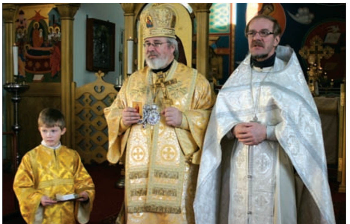
Arkkipiispa siunaa kirkkokansan ja isä Johannes kutsuu juhlalounaalle.