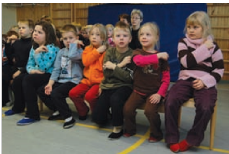
Eskarilaiset harjoittelivat ristinmerkkiä niin istualtaan kuin seisaaltaankin.

- Kirkon sisällä. - Isoisän luona taulussa, tuli vastaukseksi.