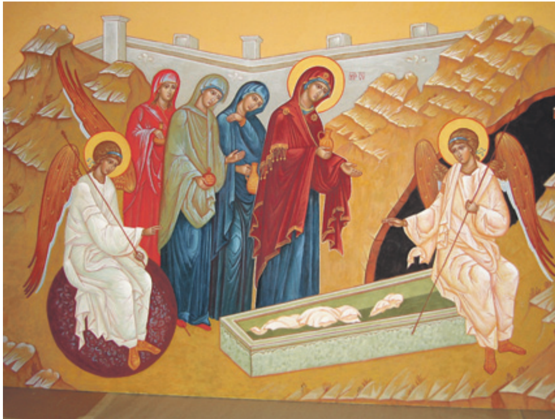
Tyhjän haudan ihme. Mirhantuojanaiset Kristuksen haudalla.