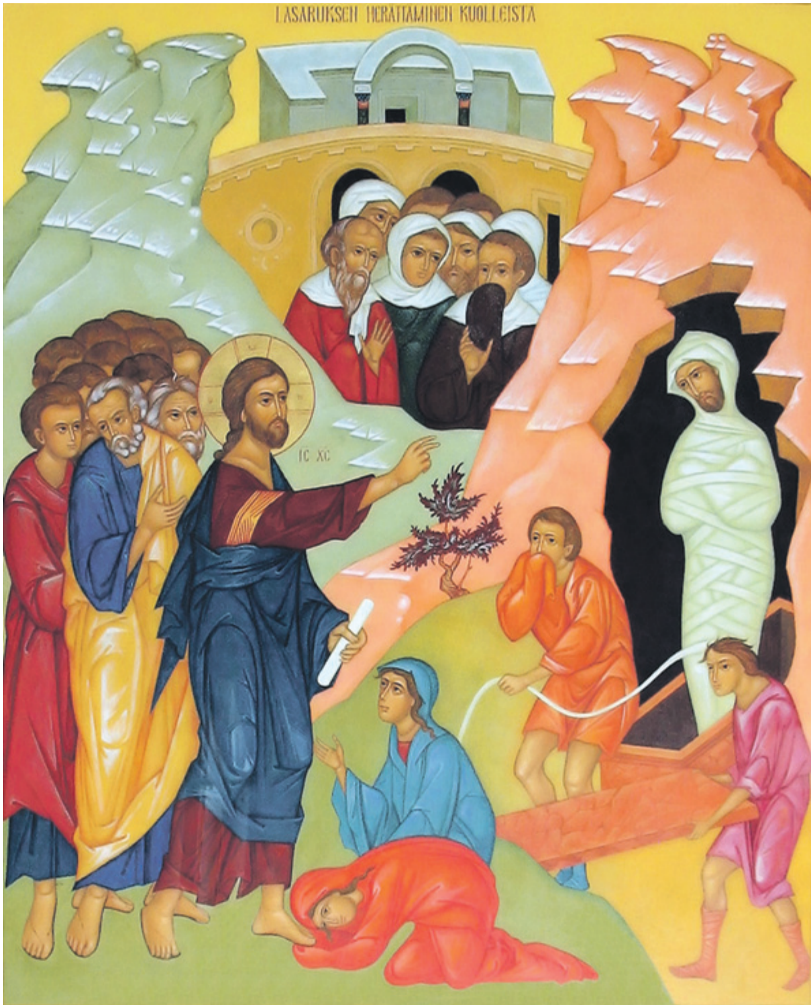
Kristus herättää Lasaruksen kuolleista. Kajaanin Kristuksen kirkastumisen kirkko.